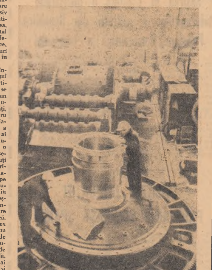
U.R.S.S. — La uzina de mașini grele „Uralmas”