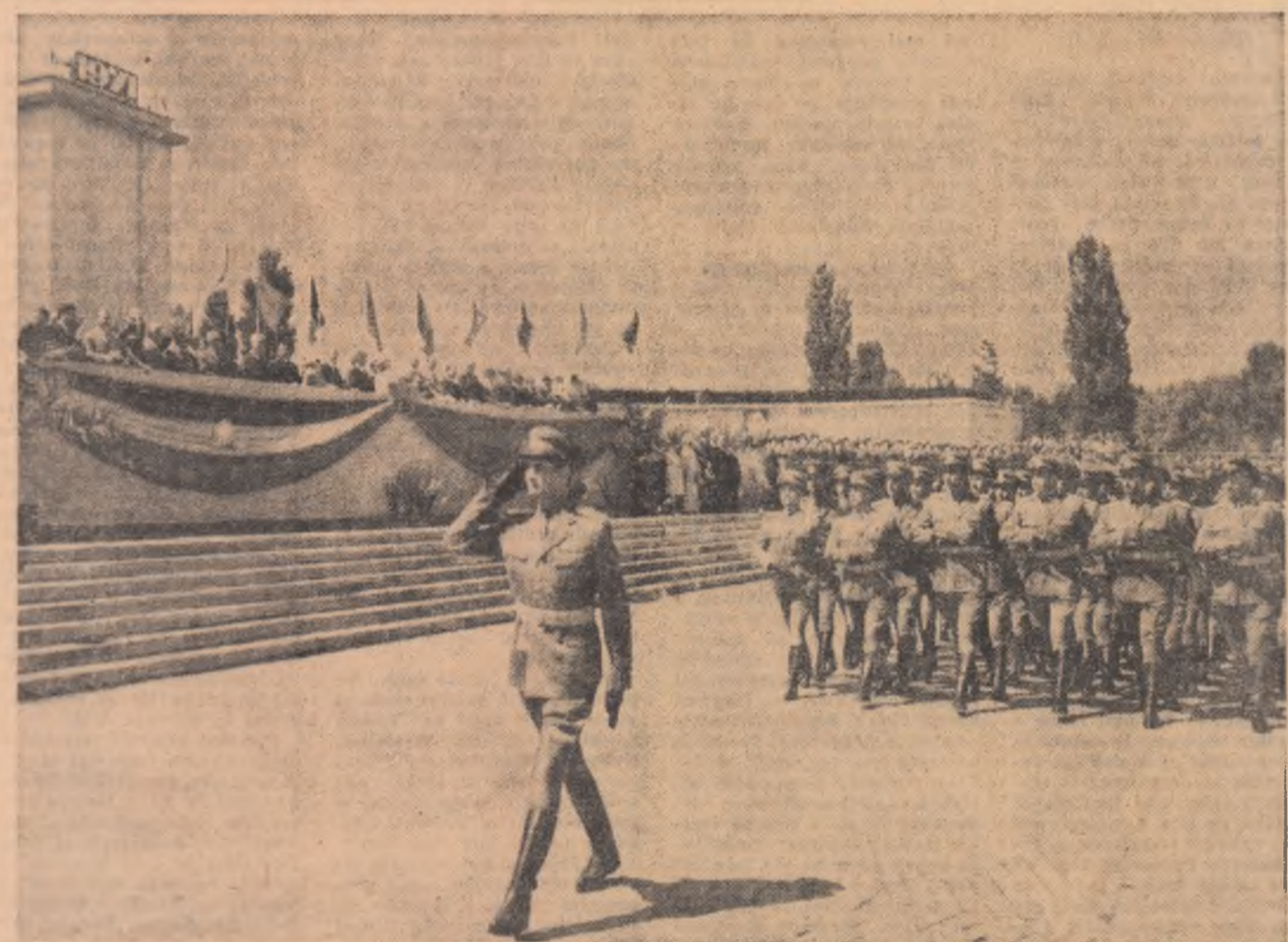
Trec în rînduri perfect aliniate apărătorii cuceririlor poporului

Exprimîndu-ne și cu această ocazie adiezuina deplină la programul de măsuri inițiat de dumneavoastră, tovarășe Nicolae Ceaușescu, pentru îmbunătățirea activității politico-ideologice, vom munci neobosit pentru ridicarea continuă a