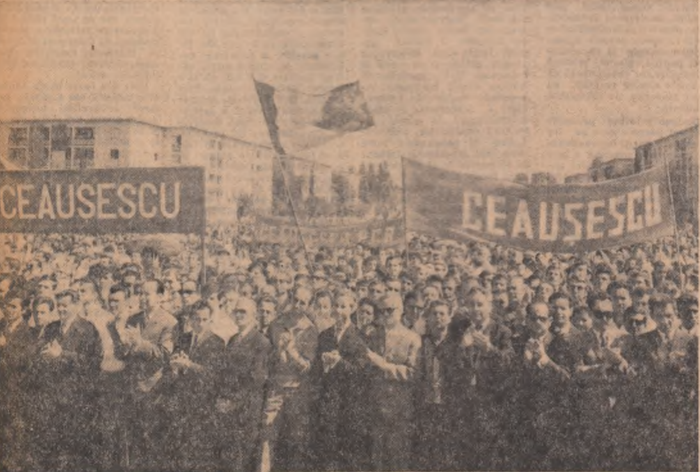
Asistența aplaudă entuziastă apariția la tribună a conducătorilor de partid și de stat, în frunte cu tovarășul Nicolae Ceaușescu

Adunarea la sfîrșit într-o atmosferă de puternică însuflețire, de vibrant patriotism, de internaționalism militant care și-a găsit expresia în lozincile la adresa întării unității țării socialiste, a mișcării comuniste și muncitorești internaționale. Se aud cuvîntele de slavă pentru partid, pentru patria socialistă, pentru harnicul și talentatul popor român, făuritor al societății socialiste multilaterale dezvoltate.