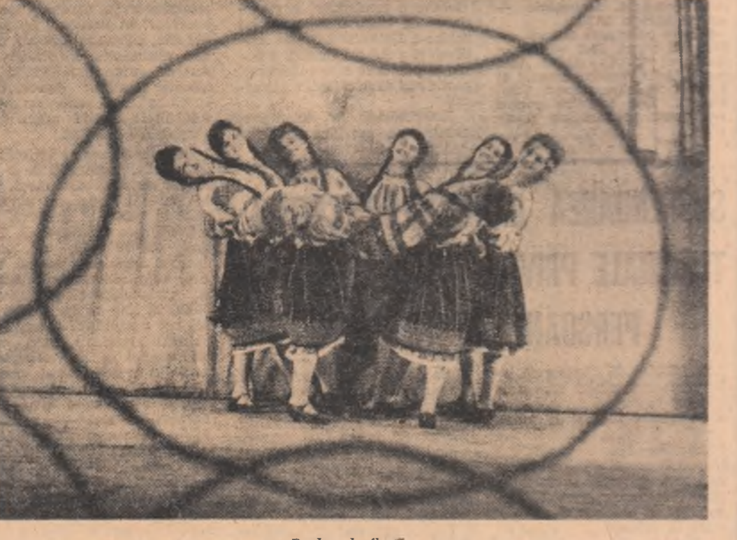
„Buchet de flori”