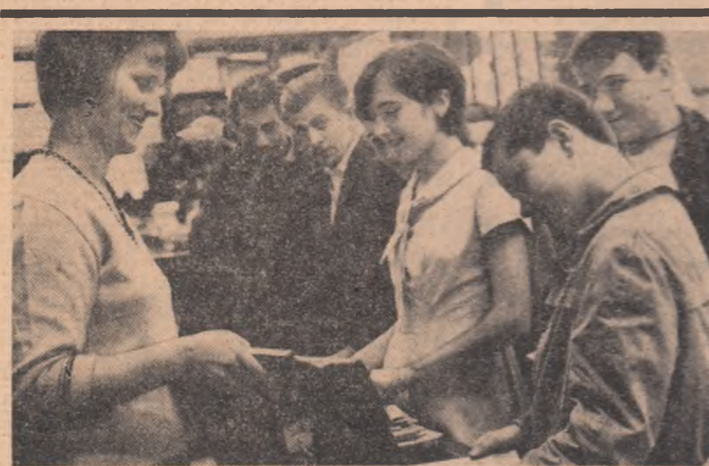
A început procurarea de rechizit școlare. Cine-și face vara sanie...