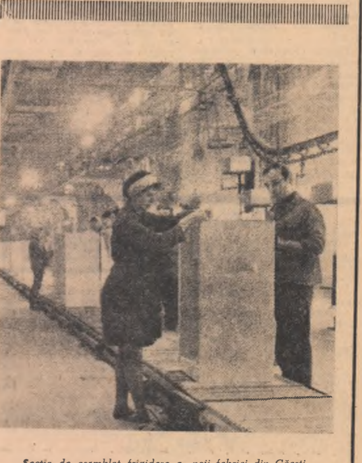
Secția de asamblat frigidera a noii fabrici din Găești.