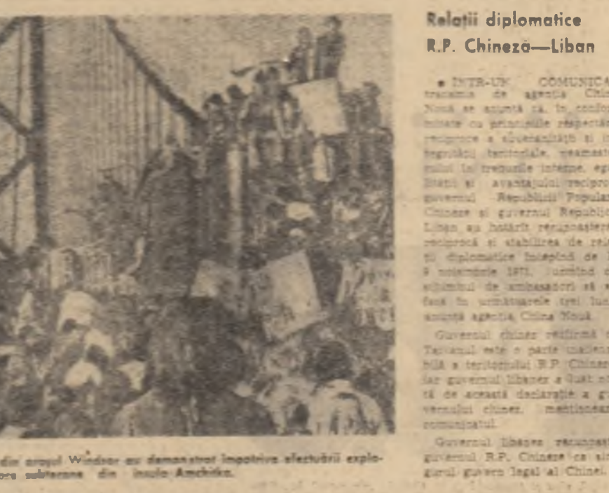
CANADA — 5.000 de studenți din grupul Windsor au demonstrat împotriva electurii exploziei nucleare subterane din insula Amchick.

Într-o declarație în care s'a lăsat vizita în Chile a lui Fidel