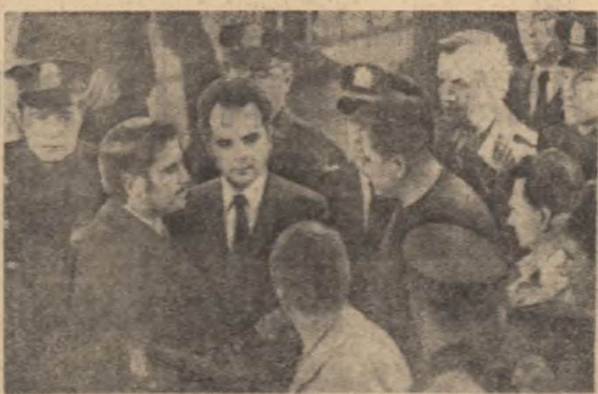
S.U.A.: Aspect de la sesiunea primei părți a delegației R.P. Chineze la O.N.U.

patru proiecte de rezoluție depuse la punctul întâi al ordii de zi, pe puzițele delegațiilor erau depuse plachete trimise de către echipajul navei cosmice „Apollo 14”, în care erau impatruite drapelul național al statelor membre ale O.N.U. (draple care s'au aflat la bordul navei „Apollo 14”). Delegația americană în Comitetul Politic, Alan Shepard, comandantul misiunii „Apollo 14”, a declarat că aceste daruri semnificative contribuie întregii omeniri la progresul științei și tehnicii moderne care a făcut posibil zborul omului spre satelitul natural al Pământului.