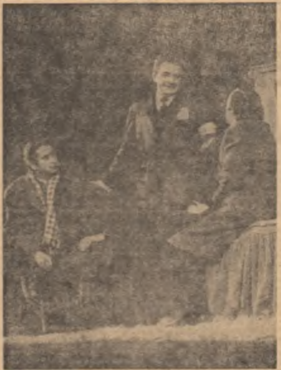
Scenă din piesa „Interesul general”.