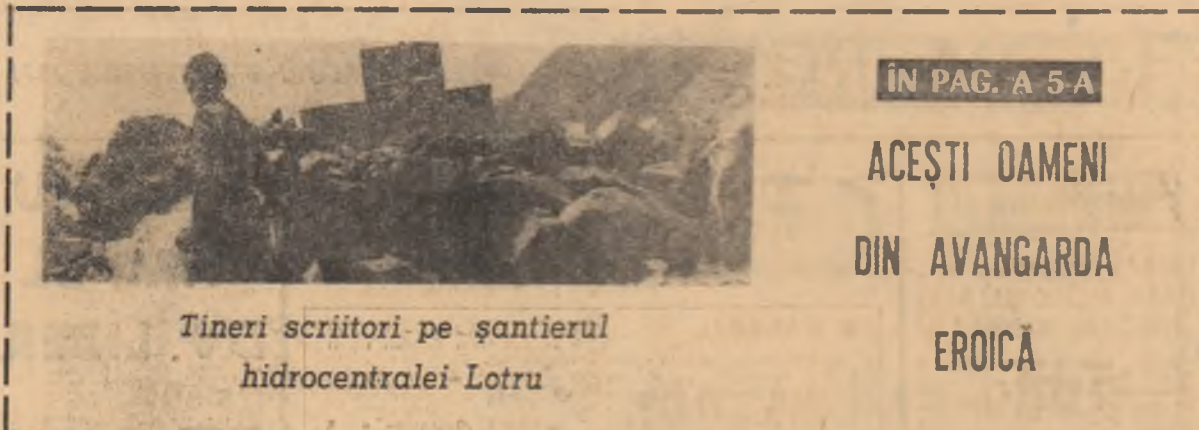
Tineri scriitori pe șantierul hidrocentralei Lotru