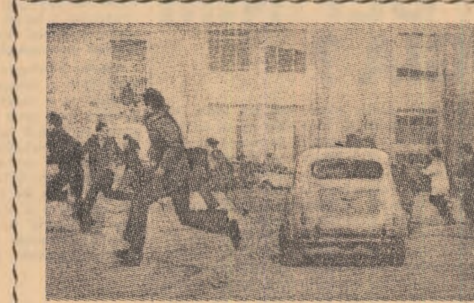
La Madrid continuă greva de protest a celor 57 000 de studenți împotriva reprimărilor brutale de către poliția și demonstrațiilor organizate în zilele precedente, în fotografiile noastre.

MICHAEL KOHL, secretar de stat la Construcția de Miniștri al R.D. Germane, și Egon Bahr, secretar de stat la Cancelaria Federală a R.F. a Germaniei, au continuat la 20 și 21 ianuarie, însoții de delegații, tratativele asupra unui acord cu privire la traficul între R.D. Germană și R.F. a Germaniei. Tratatul va avea loc la sediul Consiliului de Miniștri al R.D.G. Părțile au căzut de acord, menționând agenția A.D.N., să continue convorbirile la 2 februarie, la Bonn.