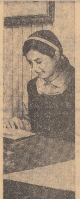
Ore de studiu în cabinetul de științe sociale