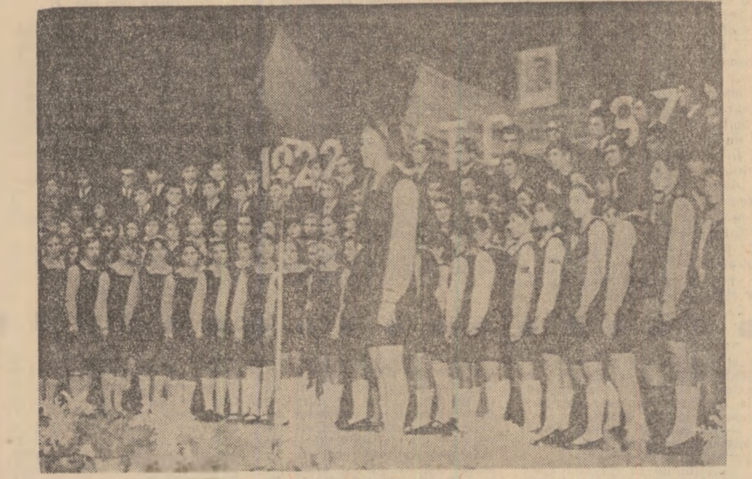
Moment din spectacolul festiv oferit în cinstea noilor membri ai organizației.