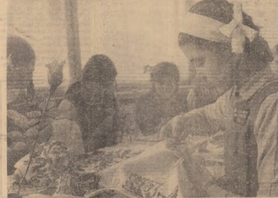
Școala generală nr. 3 din Bistrița. Eleve în atelierul de practică