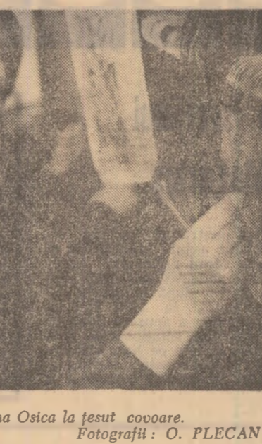
Tineri din comuna Osica la fesuț covoare.