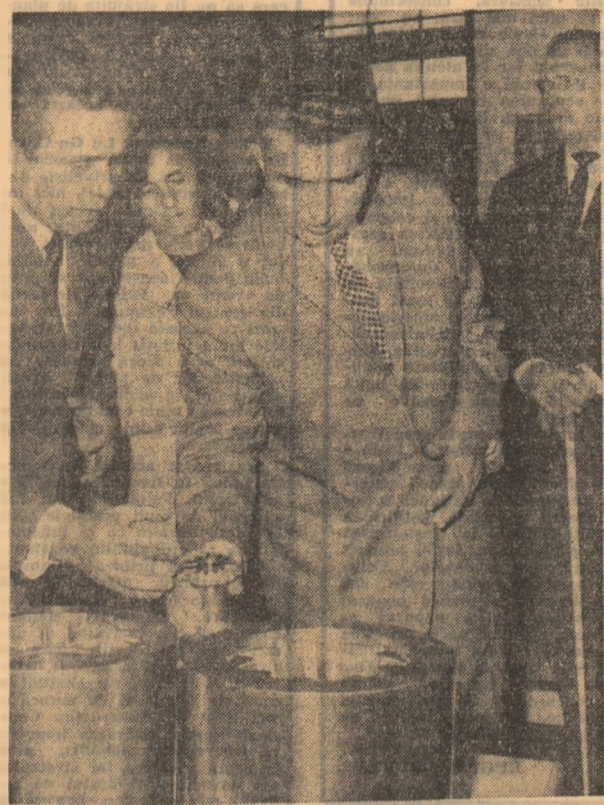
Sunt reprezentate în expoziție cu rezultate remarcabile, domeniile de vîrf ale tehnicii contemporane — electrotehnica, electronica, mecanica fină tehnica vidului. În actualul plan cincinal acestor ramuri de producție le revine o sarcină deosebit de importantă atît în direcția dezvoltării producției și diversificării ei cît și în modernizarea sortimentelor fabricate. Se remarcă, printre multe altele expozite, aparatură subliniază necesitatea impulsivității activității științifice și de concepție pentru ca aceasta să-și aducă o contribuție mai substanțială la înfăptuirea sarcinilor pe care partidul le pune în domeniul autoutilării în momentul de față. Se subliniază necesitatea rezolvării în țară a unor probleme tehnologice complexe pentru a nu se născă decît în măsura minimă la import de tehnologie. De asemenea, în discuțiile cu specialiștii de la standurile se subliniază necesitatea ca fiecare fabrică, fiecare secție, fiecare inginer, tehnician și muncitor să fie antrenat în această acțiune de concepție și realizare de noi mașini-unelte.

În sectorul întreprinderilor constructoare de rulmenți, atrage atenția dispozitivul semi-automat de sortare și asamblare a rulmenților, conceput și construit de colectivul uzinelor „Rulmentul” din Brașov, iar în standurile Centralei industriale de mecanică fină și scule se află o gamă largă de utilaje și mașini realizate prin autoutilare pentru diferite secțiuni ale construcției de mașini. Aici specialiștii prezintă tehnologii noi de turnare și formare, de tratamente termice, proiecte proprii de utilaje, aparate de măsură și control. Secretarul general al partidului subliniază necesitatea impulsivității activității științifice și de concepție pentru ca aceasta să-și aducă o contribuție mai substanțială la înfăptuirea sarcinilor pe care partidul le pune în domeniul autoutilării în momentul de față. Se subliniază necesitatea rezolvării în țară a unor probleme tehnologice complexe pentru a nu se născă decît în măsura minimă la import de tehnologie. De asemenea, în discuțiile cu specialiștii de la standurile se subliniază necesitatea ca fiecare fabrică, fiecare secție, fiecare inginer, tehnician și muncitor să fie antrenat în această acțiune de concepție și realizare de noi mașini-unelte.