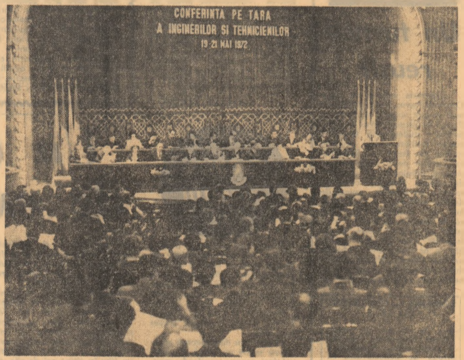
Aspect de la ședința de încheiere a Conferinței.