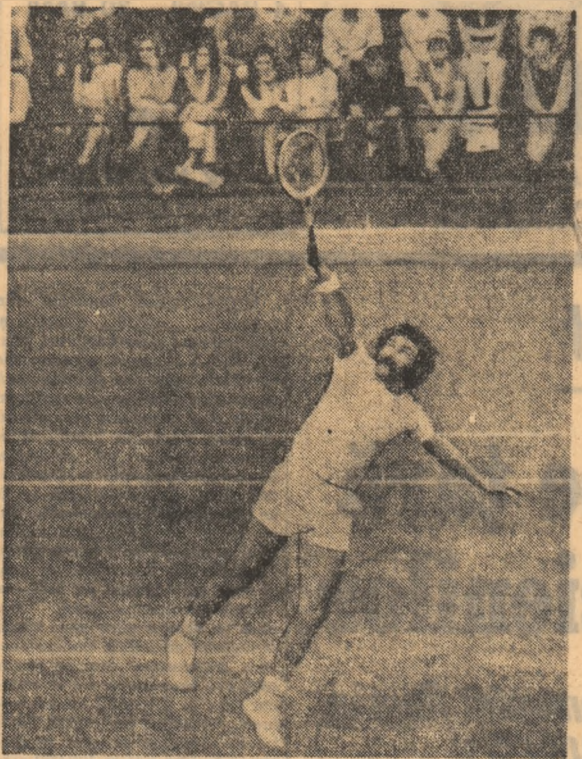
În „Cupa Davis”: România-Iran 5-0

și gustat de cei prezenți în tribune, a constituit o nouă dovadă a forței și capacității de mobilizare, organizare și execuție de care au dat dovadă studenții cadrele didactice.