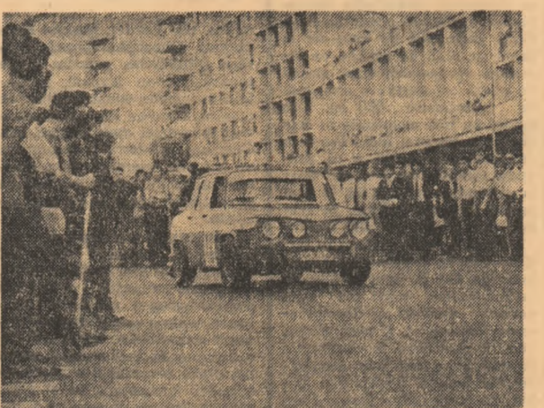
În cursa automobilistică „Raliul Porților de Fier”

KLADOVO, (prin telefon de la trimitul nostru).