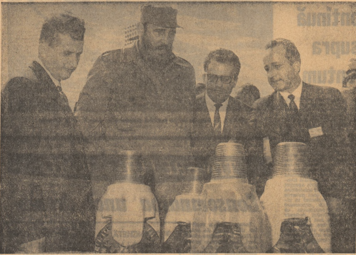
Oaspeții primesc explicații privind unele produse ale Uzinei „1 Mai”