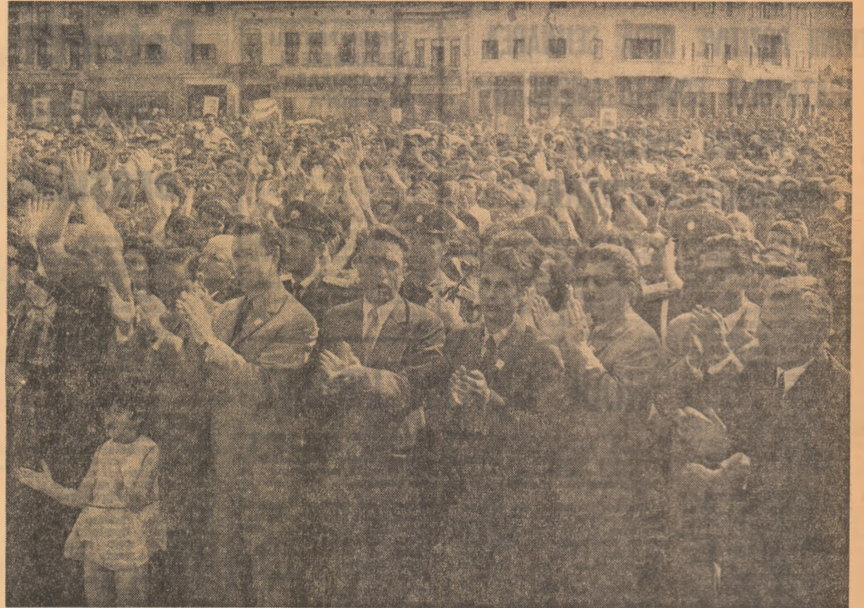
Milii de oameni ai muncii își exprimă entuziasmul față de Cuba socialistă, față de conducătorii celor două țări prietene