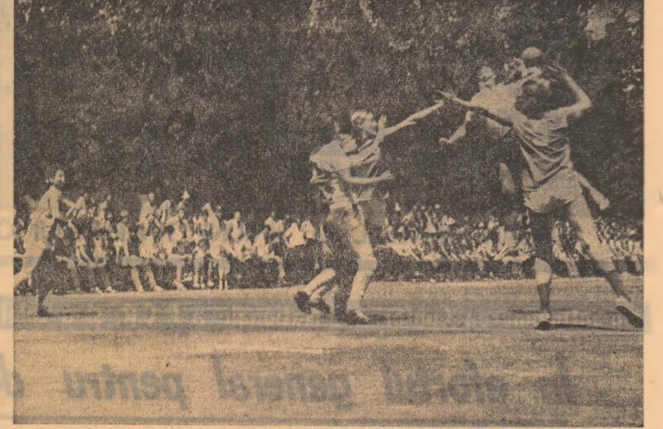
Datorită unei rare spectaculozități partida feminină de handbal „U” Timișoara — „U” Bucu- reștii a justificat interesul cu care a fost așteptată.

— Într-un grup de activitate am văzut și alte asemenea acțiuni. — Într-adevăr, în planul de muncă al biroului Comitetului județean U.T.C., întocmit în vederea intimpinării Conferinței Naționale a Partidului, am înscris unele obiective care se bucură de un deosebit interes din partea tinerilor, ceea ce pentru noi reprezintă o garanție că ceea ce ne-am propus se va realiza. — Apa, de pildă, ne-am propus să participăm cu brigăzile noastre de muncă voluntar patriotică la construirea canalizării orașelor Mărășești, Adjuș și Odobești, la construirea a 70 săli de clasă și a două ateliere școlare, a bazei sportive Focșani Sud și „23 August”. În prezent, pe șantierul canalizării din Adjuș muncesc 21 de brigăzi ale tinerilor, 15 brigăzi la amenajarea bulevardului „București”, altele la construcția școlilor de clasă amenajate. Menționăm însă că toate aceste acțiuni reprezintă tot atâtea inițiative din partea tinerilor, a organizațiilor U.T.C. din Țara Vrancei.