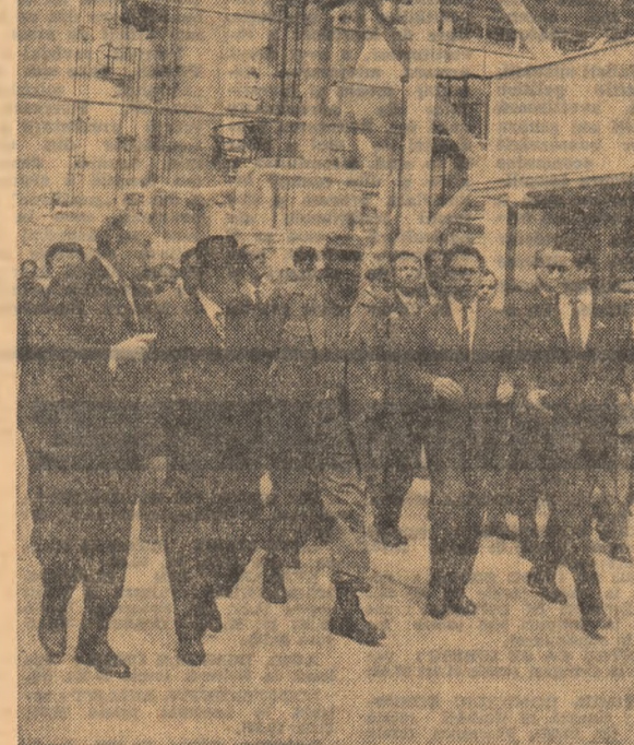
Este vizitată o mare unitate industrială a țării: Grupul Industrial de petrochimie Ploiești

Dorim să vă mulțumim în numele delegației. Trăiască prietenia dintre popoarele României și Cubei! (Aplauze puternice, îndelungi). Se ovaționează pentru prietenia româno-cubaneză, se scandează „Ceaușescu—Castro”.