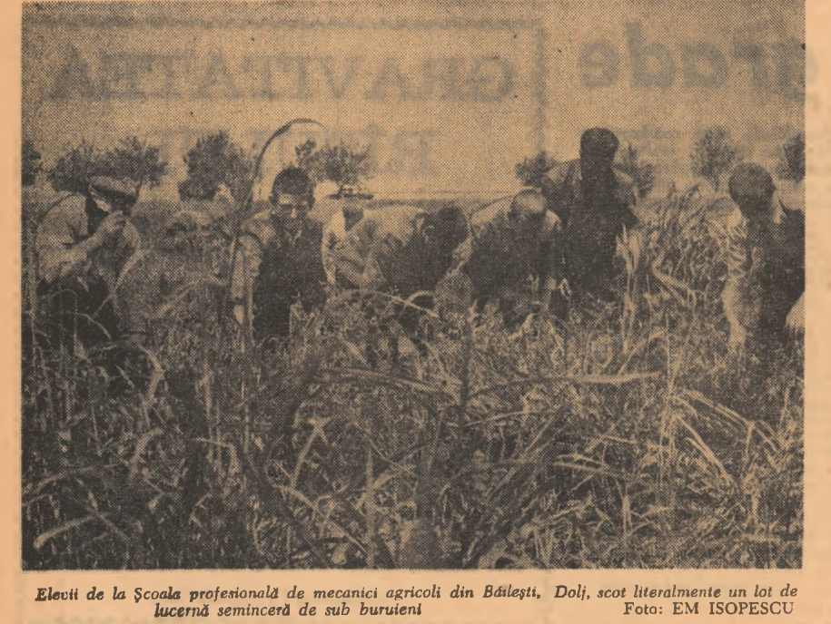
Elevii de la Școala profesională de mecanici agricoli din Bălești, Dolj, scot literalmente un lot de lucrări semincă de sub burteni