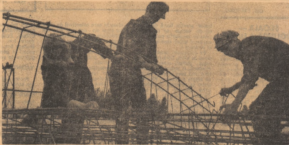
Fierari betonisti lucrind la căminul tinerilor mineri din Cimpulung-Muscel