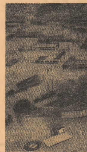
U.S.A.: Orașul Richmond acoperit de apele dezlănțuite ale râului James în timpul celor mai mari inundații din istoria acestei țări

În context, el s-a referit la conceptul unei păci echitabile și durabile între cele două țări, arătând că acesta include, după opinia sa, „necesitatea eliberării prizonierilor de război pakistanezi” și „retragerea trupelor de la frontiere”. Președintele Bhutto a subliniat, de asemenea, că Pakistanul aderă la principiul „autodeterminării populației din Casmir”. Totodată, el a declarat că probleme referitoare la existența Republicii Bangladesh nu vor fi abordate cu ocazia reuniunii de la Simla și și-a reafirmat dorința de a-1 înfrinți pe șeful Mujibur Rahman, premierul guvernului de la Dacca.