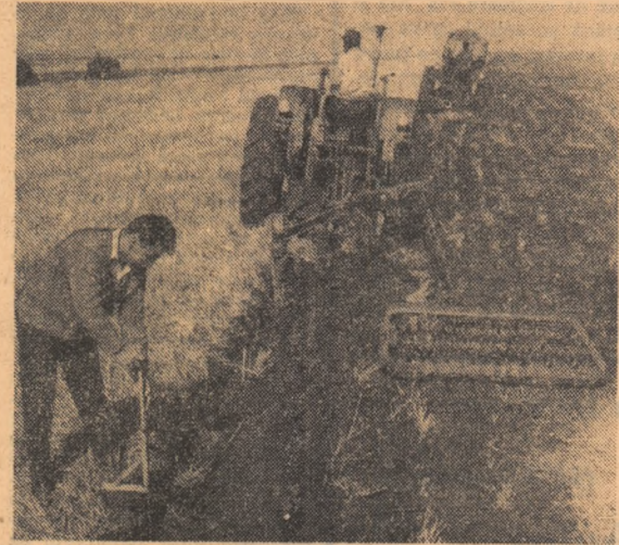
După ce au recoltat orzul, mecanizatorii ce deservesc cooperativa agricolă din Pusan, județul Teleorman, pregătesc terenurile pentru însămînțările culturii duble