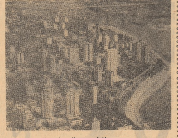
Imagine din orașul Vancouver.