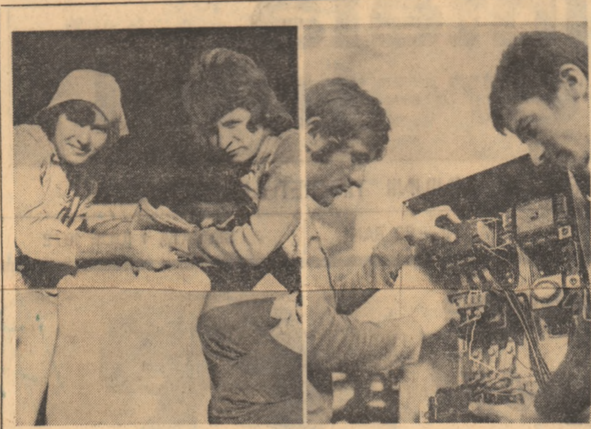
În stînga : Întîlniri plăcute, sub semnul muncii, între colegii de la mai multe școli. În dreapta : Găsim de lucru aici, la cooperativă, pentru foarte multe meserii.

— adunările generale U.T.C. de la începutul anului referitoare la cifrele de plan, cînd tinerii s-au angajat efectiv să obțină rezultate cât mai bune ; cele dinaintea declanșării campaniei, în care s-a discutat specificul lucrărilor de executat la recoltare și tehnica culturilor prașitoare, s-au dat lămuriri de către conducerea C.A.P., asupra unor condiții și termene, privind organizarea muncii ;