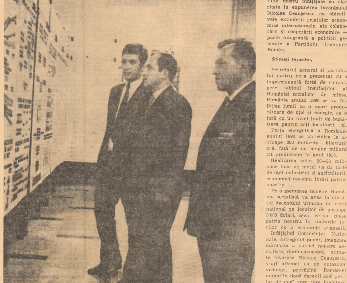
Intr-una din pauzele Conferinței

Înfrățind Conferinței Naționale, întregului popor, imaginea minunată a patriei noastre socialiste, dumnea noastră, stimați tovarăși Nicolae Ceaușescu, v-ați afirmat ca o cutezător vizionar, prevăzînd României numai în două decenii al „viitor de aur” spre care înaintașii nostri luminați visau de-abia prin secolii a ei înfrățire.