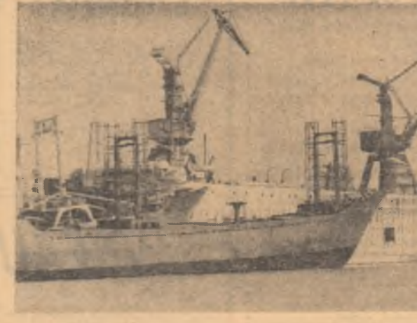
Prin strădania și priceperea constructorilor de la Șantierul naval Galați, prind contururi noi vase ce vor înfrunța întinutul nesfîrșit al apelor