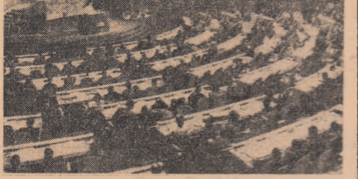
În timpul lucrărilor actualei sesiuni a Adunării Generale.