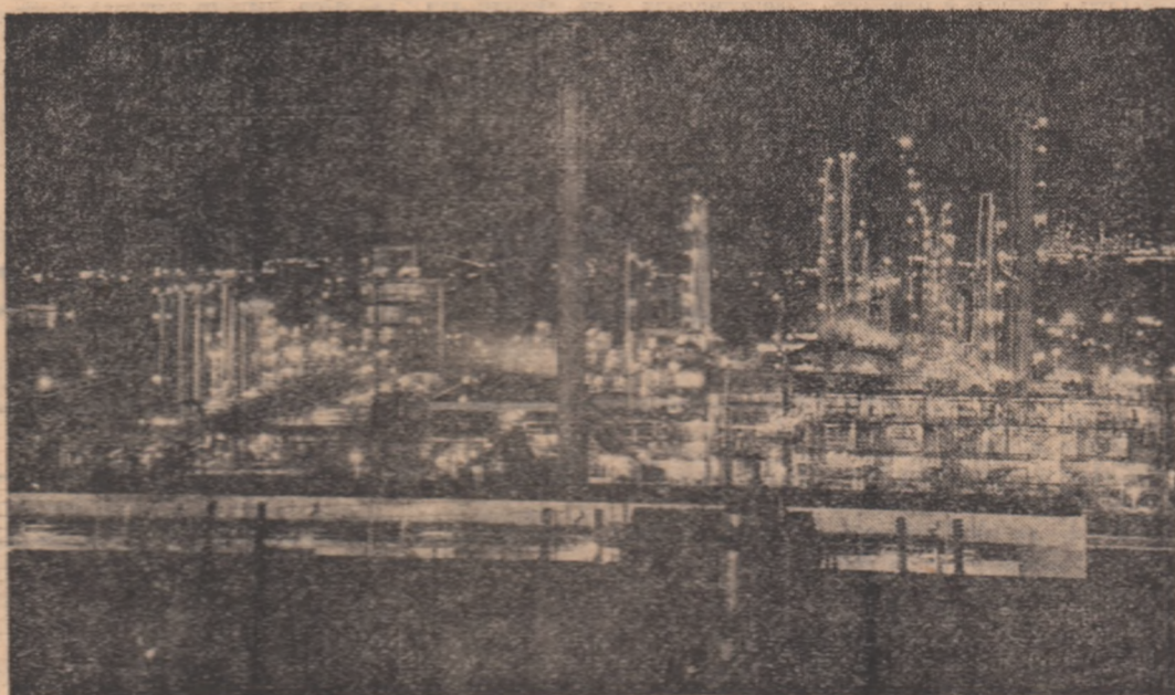
Vedere panoramică nocturnă a Combinatului petrochimic Pitești

cetatea numărul 3 a industriei românești