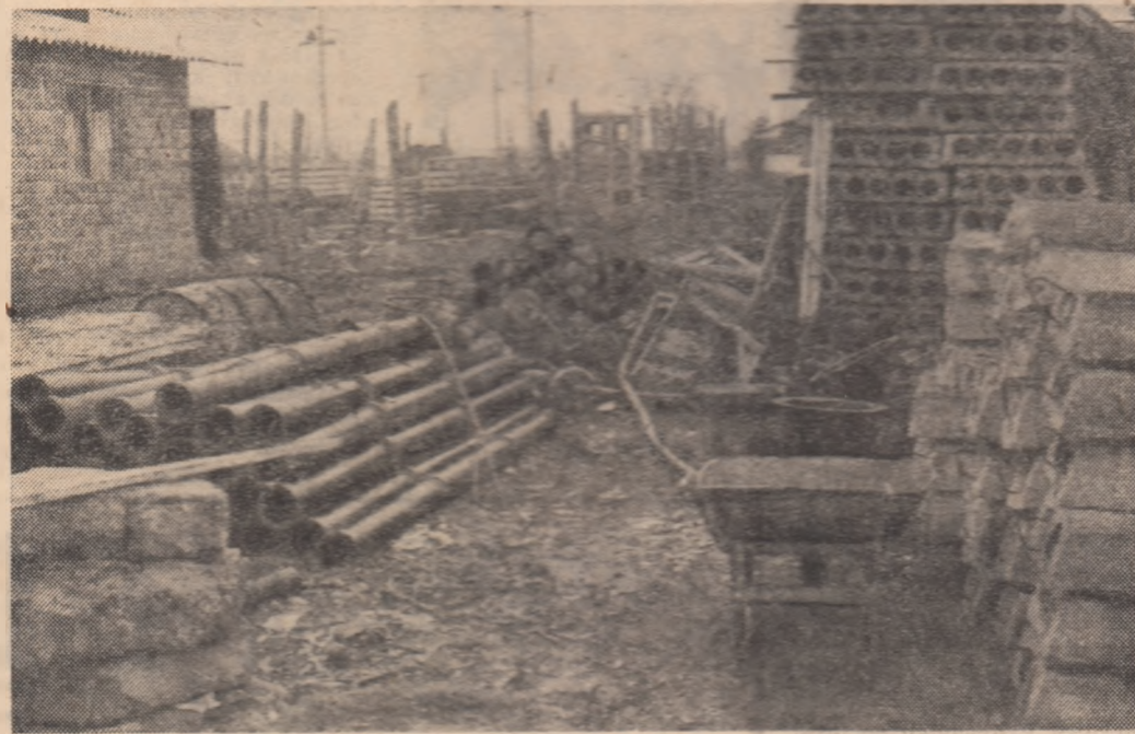
— Mai mult nu s-a făcut, decât s-a făcut, ne-a răspuns dumnealui eliptic. Apare că tinerii nu au făcut nimic, dar așa... împreună cu ceilalți muncitori.

Al doilea argument ține de caracterul acțiunilor mari care poartă direct amprenta organizațiilor U.T.C. Printre altele este vorba aici de preluarea de către organizațiile comunale U. T. C. a sarcinii însoțirii furajelor, de constituirea unor echipe de tineri pentru transportul produselor în baze, a altor echipe pentru