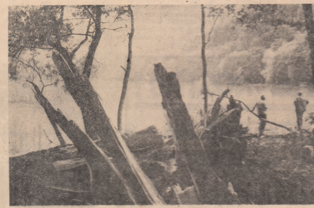
Un pitoresc punct turistic pe calea Trotușului: lacul Bălățu