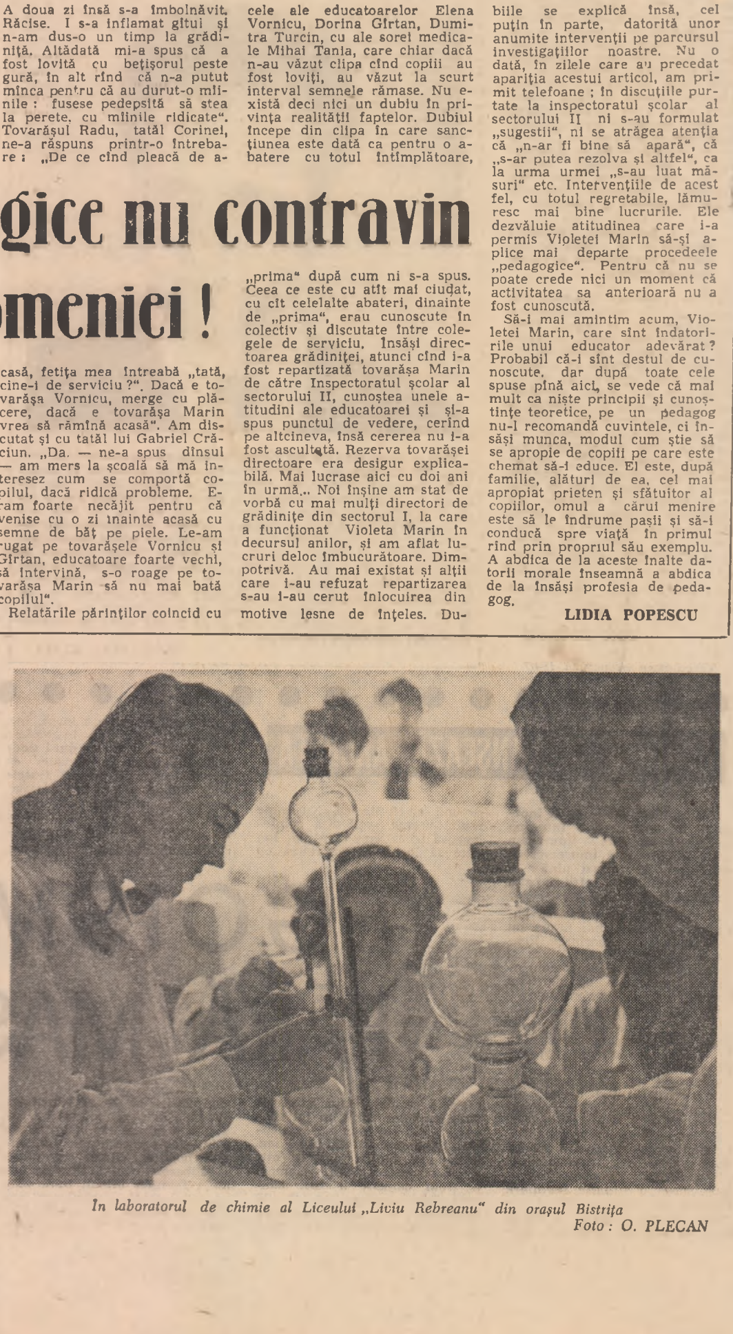
În laboratorul de chimie al Liceului „Liviu Rebreanu” din orașul Bistrița.