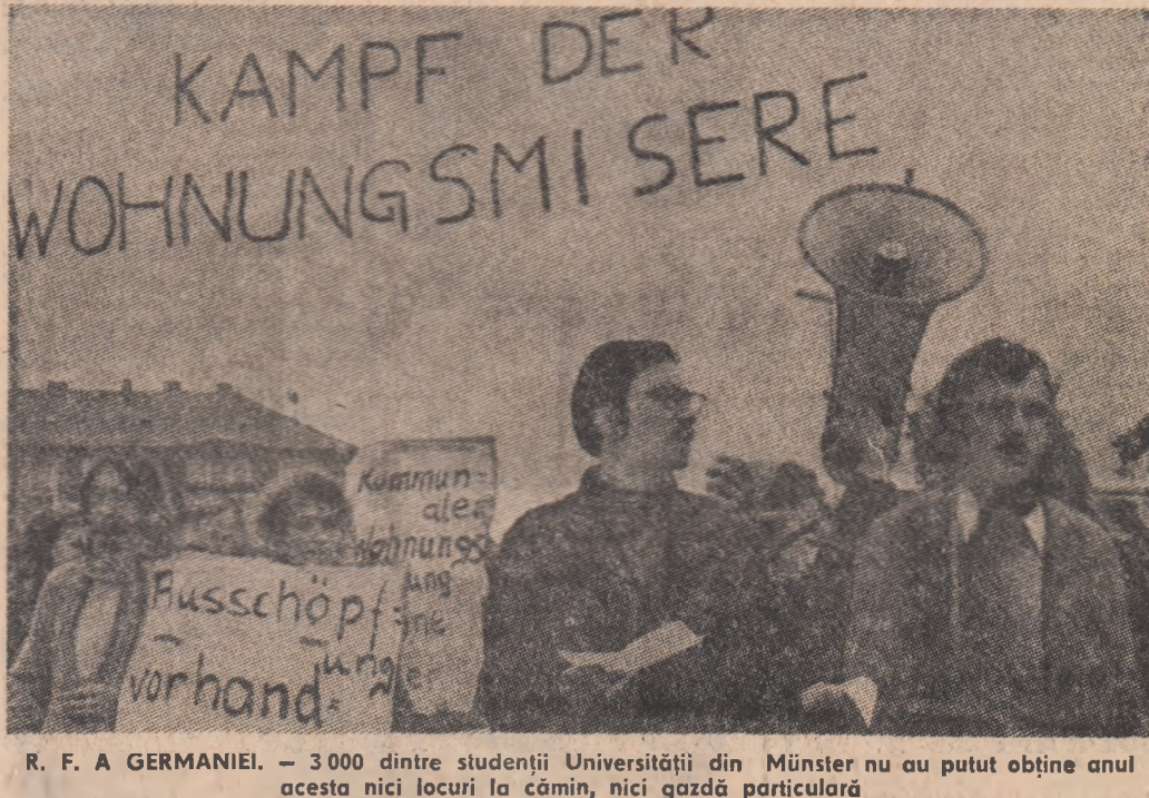
R. F. A. GERMANIEI. — 3000 dintre studenții Universității din Münster nu au putut obține anul acesta nici locuri la cămin, nici gazdă particulară

Nord, Statelor Unite ale Americii și Republicii Franceze, reprezentate de ambasadorii lor, care au avut o serie de întîlniri la fostul sediu al Consiliului de control aliat, au căzut de acord să sprijine declarațiile cu privire la cererea de primă în Organizația Națiunilor Unite, atunci cînd vor fi prezentate de Republica Democrată Germană și Republica Federală a Germaniei și reafirmă, în legătură cu aceasta, că participarea lor ca membri la O.N.U. nu trebuie să afecteze în nici un caz drepturile și responsabilitățile celor patru puteri și acordurile cvadripartite corespunzătoare, hotărîri și practica legate de aceasta. (Agerpres)