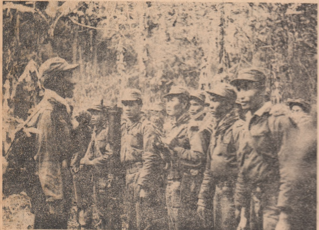
LAOS: Un detașament al forțelor patriotice înainte de a porni într-o nouă misiune de luptă.