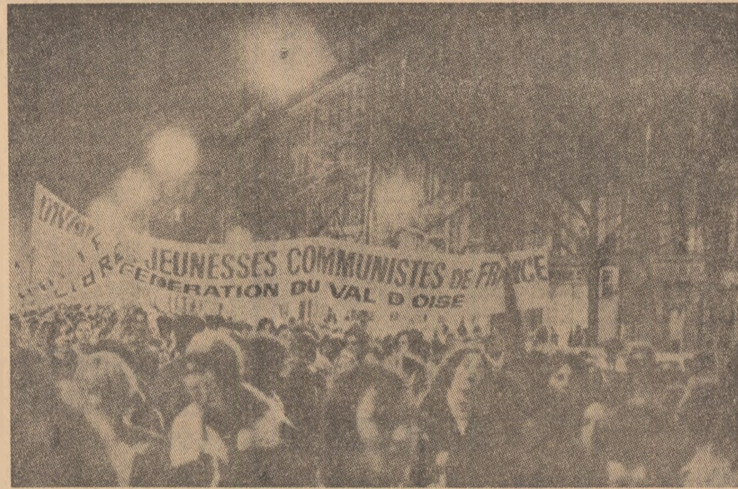
Demonstrația a tinerilor comunisti francezi în sprijinul unității forțelor de stînga din Franța.

Mitraliera deținuților politici din Managua a avut dar să readucă Nicaragua în veritabilul ei context politic și social. Des-