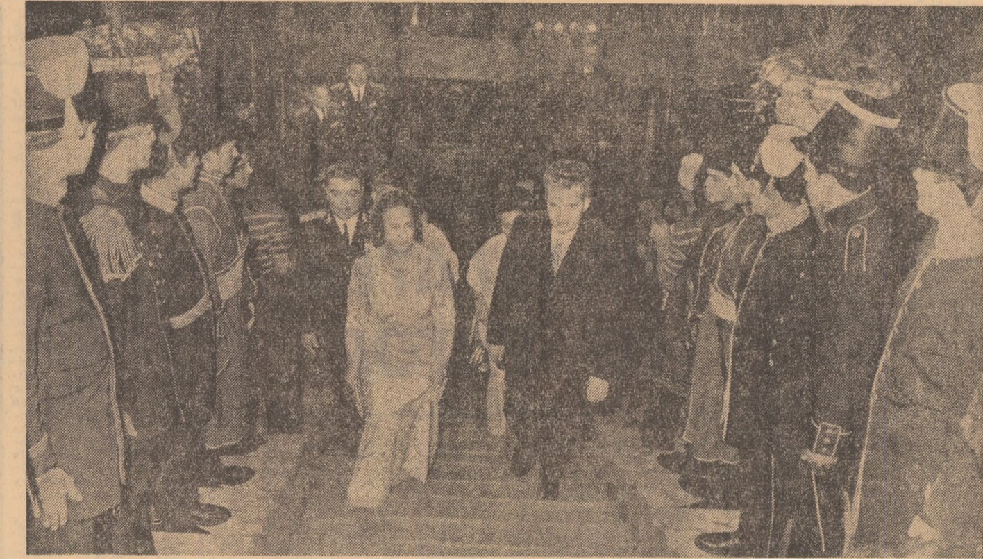
Dineul oferit de Ministerul Apărării Naționale și Ministerul de Interne