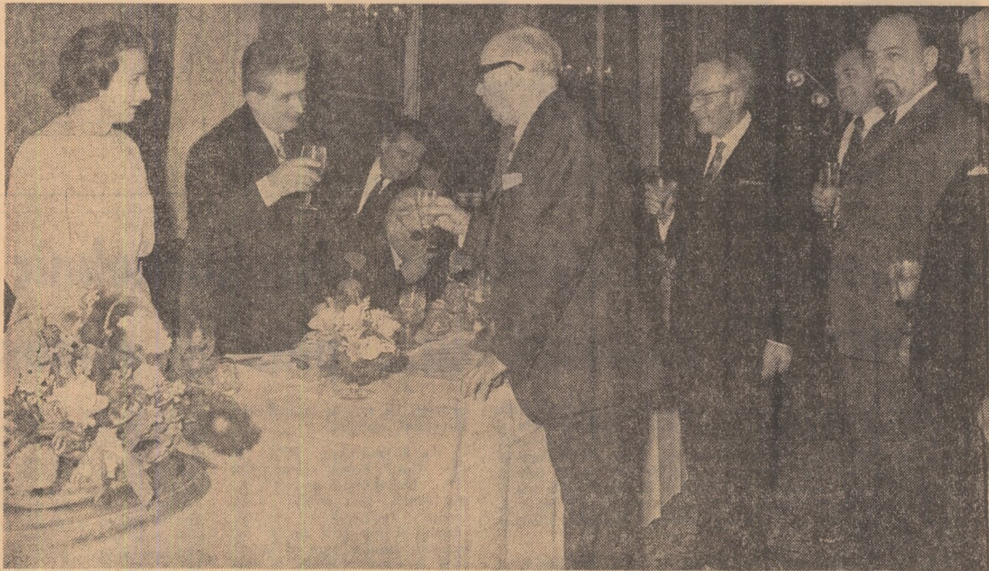
Dejunul oferit de C. C. al P. C. R., Consiliul de Stat și Consiliul de Miniștri