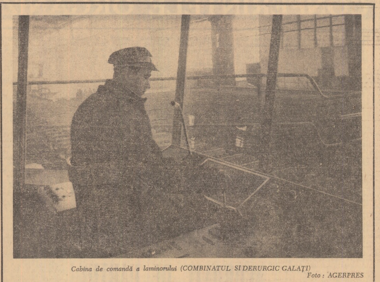
Cabina de comandă a laminorului (COMBINATUL SIDERURGIC GALAȚI)