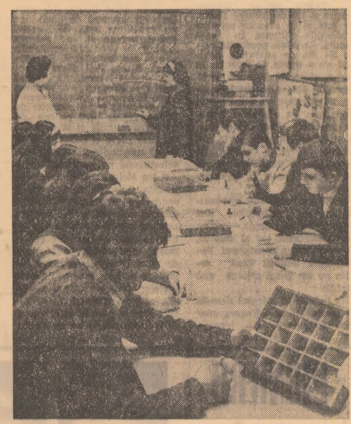
Oră de laborator la Liceul agricol din Miercurea Ciuc