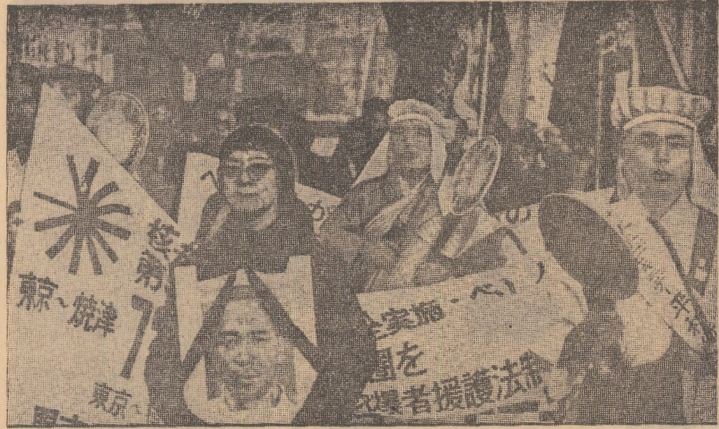
Demonstrație la Yokohama pentru interzicerea armelor nucleare. În prim plan, fotografia unei victime a exploziei nucleare de la 1 martie 1954 din atolul Bikini.