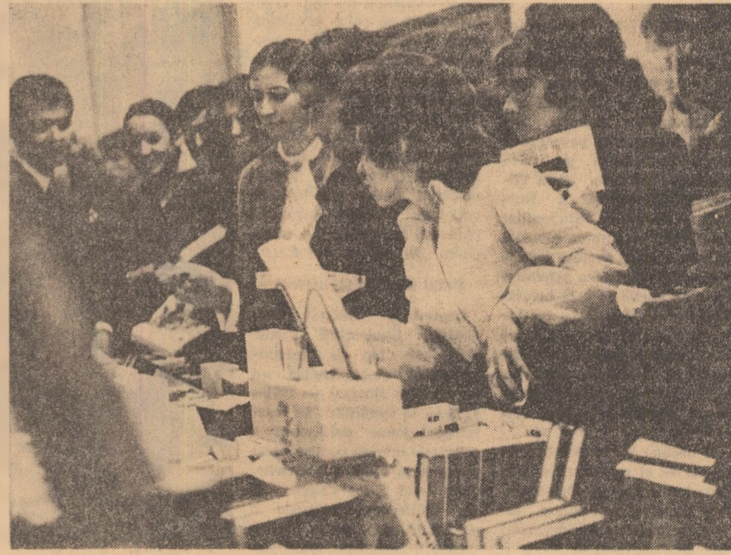
În timpul unei pauze a lucrărilor Conferinței.

În încheiere, a spus vorbitorul, dați-mi voie ca în numele studenților gălățeni să-mi exprim acordul cu noile prevederi ale statutului și cu noua denumire a uniunii, care confirmă o realitate obiectivă, aceea a existenței studentului-comunist.