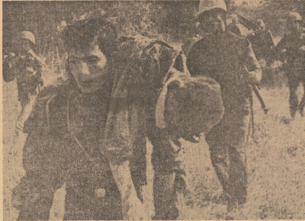
Soldații ai regimului Iannolist retrăgându-se sub loviturile forțelor patriotice cambodgiene.