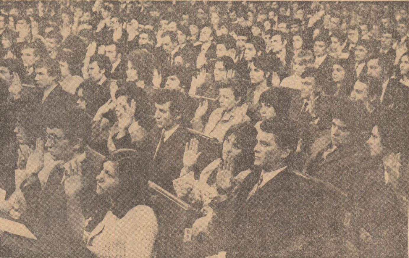
Se votează ordinea de zi a Conferinței

Consider că în condițiile de astăzi un rol important revine, alături de celelalte forțe sociale, tinerii generații, tineretului universitar de pretutindeni, care constituie o forță tot mai activă în lupta pentru progres și pace, pentru transformarea revoluționară a societății. De aceea Uniunea Asociațiilor Studenților Comunisti din România va trebui să dezvolte larg colaborarea cu toate organizațiile studențesti din țările europene, din toate statele lumii, contribuind la unirea eforturilor tineretului de pretutindeni în lupta pentru o politică de pace și colaborare, pentru securitate europeană, pentru a asigura tinerii generații condiții tot mai bune de a se dezvolta, de a-și pune de a se dezvolta, de a participa mai activ la organizarea mai echitabilă a societății, la fărîrearea unei lumi mai bune, care să asigure fiecărei națiuni, fiecărui om, condiții demne și egale de viață. Această activitate internațională trebuie să constituie o preocupare mai activă a Uniunii Asociațiilor Studenților Comunisti din România! Sint conștienți că activitatea noastră internațională va fi o contribuție tot mai însemnată la realizarea politicii generale a patriei noastre, la triumful ideilor de pace și colaborare în lume. (Aplauze puternice, prelungite).