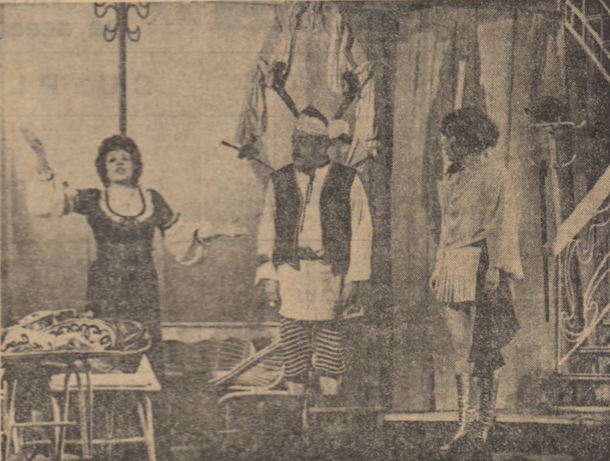
În U.R.S.S. s-a desfășurat Festivalul dramaturgiei românești. În fotografie, o imagine din spectacolul cu piesa lui Victor Eftimiu „Omul care a văzut moartea”, pusă în scenă la Moscova.