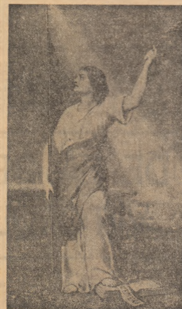
Constantin D. Rosenthal : „România rugindu-și cătușele” (1848)

În 1848 Nicolae Bălcescu avea 29 de ani. Ideoul revoluției era un tînar abia ieșit din adolescență și care ar mai fi avut dreptul la o viață pură și simplă. Ar fi avut dreptul la cite o primăvară de suflet trăită de dragul luminii, al pădurilor foșnitoare și al soarelui pe care și așa l-a văzut prea puțin. Dar în 1848 Nicolae Bălcescu străbătuse deja marile biblioteci ale lumii, adunînd cu înfrigurare atestatele de vechime și de mare istorie ale românilor. În 1848 Nicolae Bălcescu înțelăsese deja că istoria trebuie continuată. În 1848 Nicolae Bălcescu se hotărîse, el semnase deja actul de donație „în numele țării” a propriei sale biografii. Adolescențul subțire și straniu cu privirea mistuită de patimă, îndrăgise un ideal, încit anapimurile care îl devastau — seducea sub altă lumină decît lumina de soare și fericirea de care era însetat nu era una bucolică și cîmpenească, ea era o crez social : libertate pentru țară, dreptate pentru popor. A crede. A te jertfi. „Deschid sînta carte unde se află înscrisă gloria României, ca să pun înaintea ochilor fiilor ei cîteva pagine din viața eroică a părinților lor. Voi arăta acele lupte uriașe pentru libertate și unitate națională, cu care