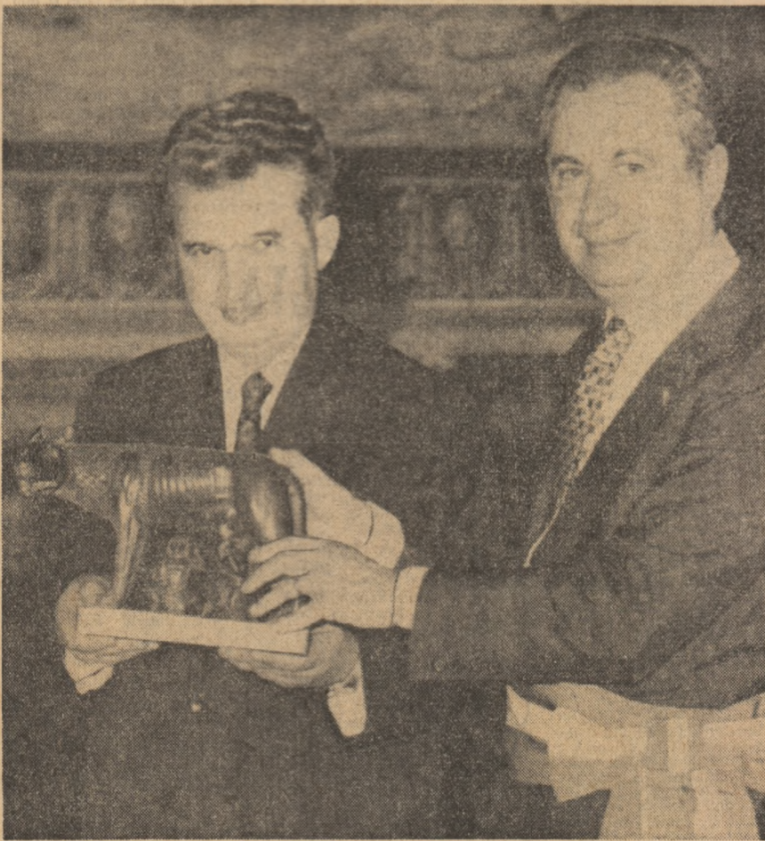
În semn de prețuire și stimă, primarul general al Romei oferă în dar președintelui Nicolae Ceaușescu simbolul „Cetății Eterne” — o miniatură a celebrului statui a „Lupoalcei Capitoline”