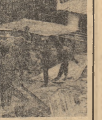
Locuitorii din satul Co To reconstruind-și casele distruse în timpul războiului.

Poporul român, care s-a situat neabătut de partea poporului