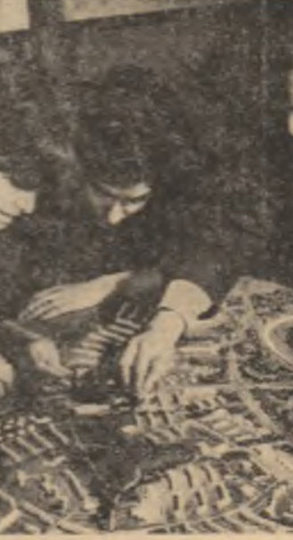
R.P. POLONA: Studenti de la Institutul de arhitectură din Varsavia construind macheta unui cartier de locuințe