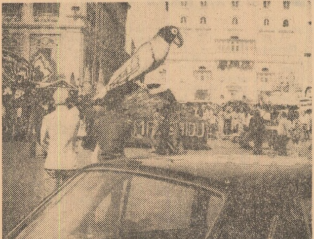
Însemnări de ȘT. O. ACHIM

Se cîntă, se dansează, se glumește. Seara, agitația Carnavalului poate fi reînviată în cluburi, săli de dans și restaurante.