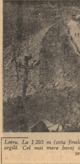
Lotru. La 1293 m (cota finală) s-a descărcat ultimul camion cu argilă. Cel mai mare baraj de anrocament din țară a fost terminat.