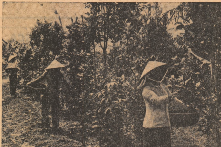
REPUBLICA VIETNAMULUI DE SUD: Tinere țărânci din districtul Gio Linh, provincia eliberată Quang Tri, stingând recolta de ceai.

Un loc important în activitatea reuniunii de la Addis Abeba l-a ocupat problema referitoare la intensificarea luptei pentru eliberarea întregului continent. În acest sens, o importanță deosebită a fost acordată extinderii asistenței acordate de țările membre ale O.U.A. celui mai tânăr stat independent — Republica Guinea Bissau.