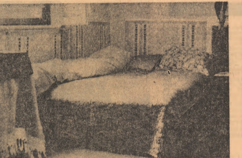
Se poate locui în gazdă și în condiții omeiești.

— Ba folosesc, tovarășe. Dar trebuie să cari la înțelegere cu constructorul, mai dai lu, mai lasă el... S-a făcut noi, de aici din București?