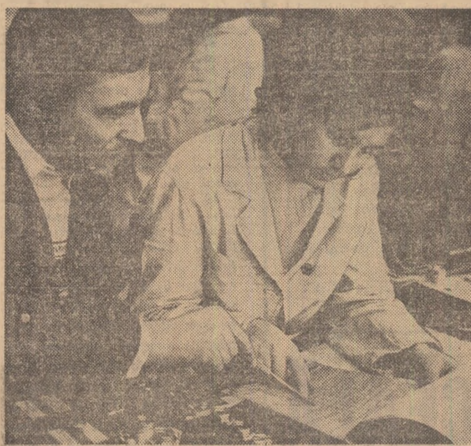
La întreprinderea de panouri și tablouri electrice — Alexandria.