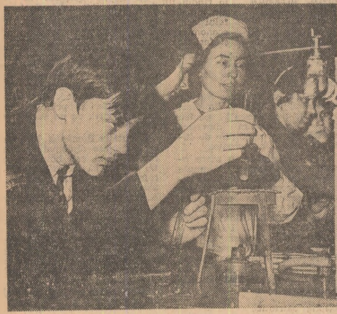
Lumea chimiei rămâne un mraț pentru elevi