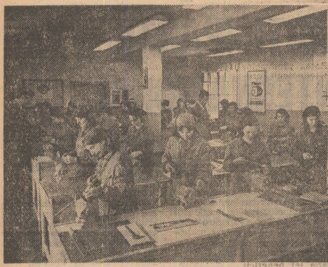
Școala profesională „Tehnometal“ din Capitală este una din instituțiile de învățământ care pregătesc tinerii pentru profesie după ce aceștia au devenit bacalauri. Aici, cum se poate observa, se pregătesc elevii: fac practică în atelierul pentru lucrări mecanice.