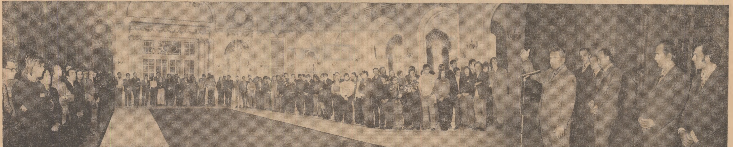
Cuvîntarea tovarășului Nicolae Ceaușescu — primită cu viu și susținut interes de către participanții la Seminarul Internațional „Studenții și Securitatea Europeană”

Design, Europa este un continent cu tradiții, o istorie, cu