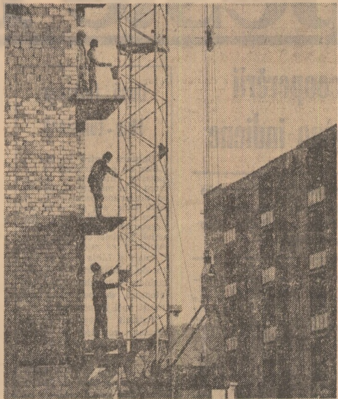
Șantier de locuințe în Bistrița-Năsăud

CRONICA U.T.C. Ieri a sosit în Capitală o delegație a Tineretului Liber din Norvegia, condusă de Knut Ringstad, secretar al Comitetului Central al acestei organizații, care, la invitația Uniunii Tineretului Comunist, va face o vizită în țara noastră. La sosit, pe aeroportul București—Otopeni, membrii delegației au fost salutați de tovarășul Radu Enache, secretar al C.C. al U.T.C., de activiști ai C.C. al U.T.C.