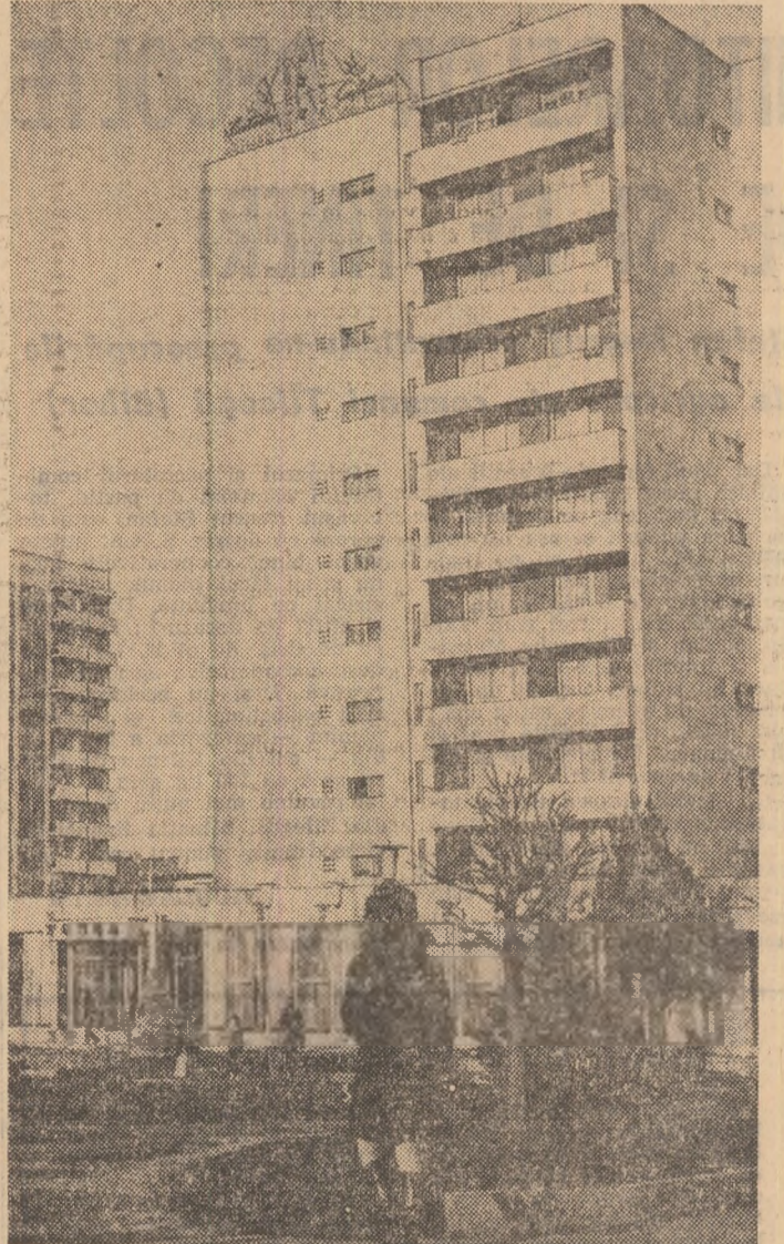
Construcții noi în orașul Miercurea Ciuc