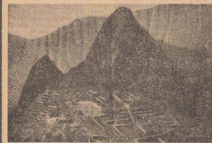
Machupichu, „imnul în piatră al unei splendori...”

O altă fațetă, inedită, a catastrofei declanșate prin înfricoșătoarea erupție a Vezuviului din primul secol al erei noastre, a ieșit recent la iveală.