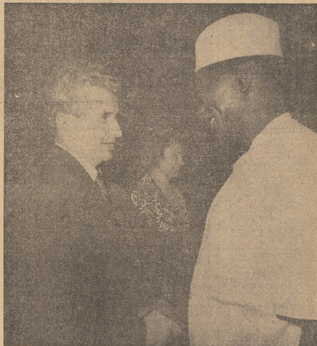
Aeroportul Internațional din Conakry. Conducătorii de partid și de stat ai celor două țări, tovarășii Nicolae Ceaușescu și Ahmed Sekou Touré își string călduros miinile