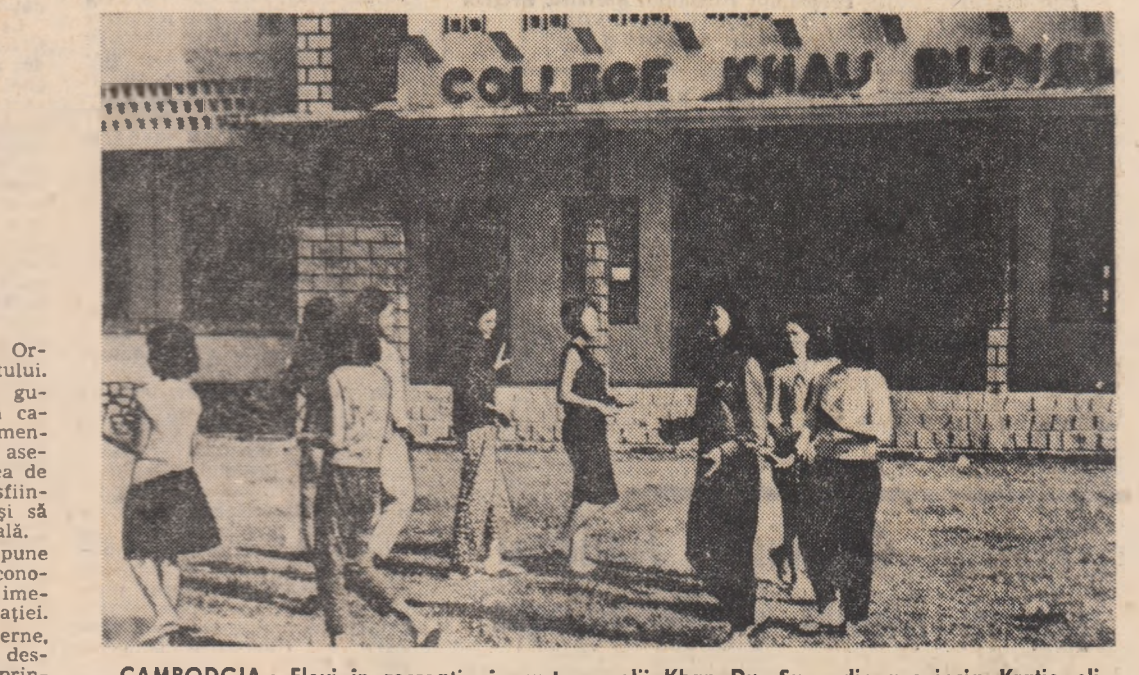
CAMBODGIA: Elevi în recreație în curtea școlii Khan Du Sun din provincia Kratie eliberată de forțele patriotice.