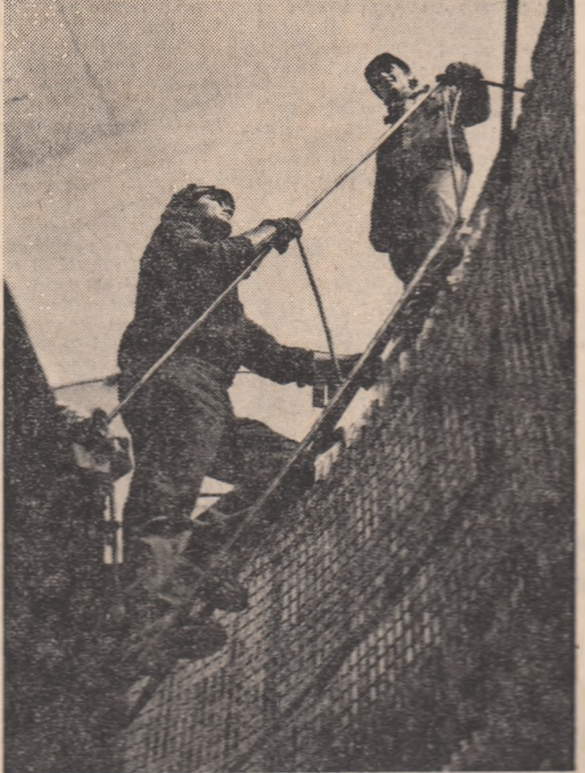
Hidrocentrala Rm. Vlcea. Spre cotele unor noi realizări.