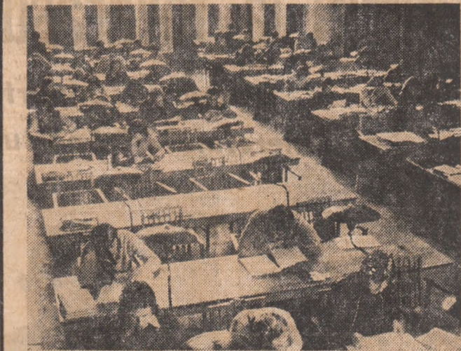
Sala de lectură a Universității din Ljubljana.

Recenta semnare la Damasc a contractului amintit interzice interzicerea „GEOMIN” și „GEOPHAM” constituie o nouă mărturie a dezvoltării continue și tot mai accentuate a cooperării prietenești dintre Republica Socialistă România și Republica Arabă Siriană.