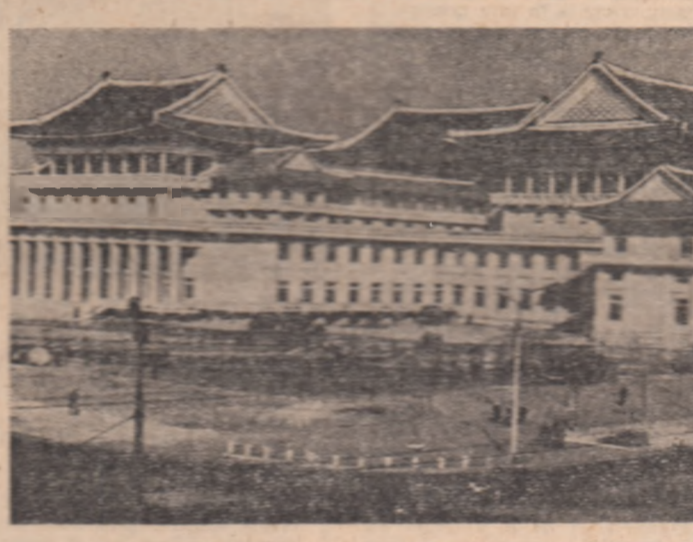
R.P.D. Coreeană. — Vedere a palatului culturii din Phentien