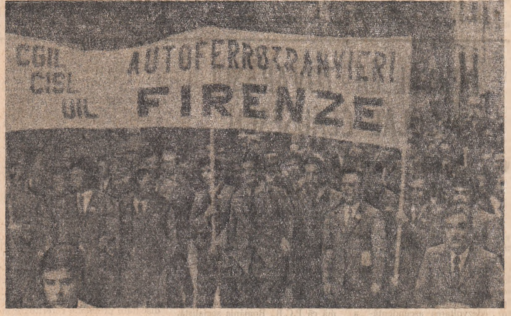
ITALIA. — Aspect din timpul unei recente demonstrații a oamenilor muncii împotriva creșterii continue a costului vieții