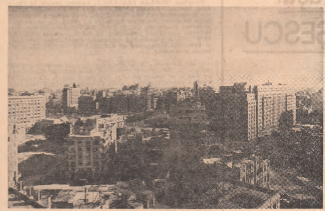
R. A. EGIPTE. — Vedere din Cairo.