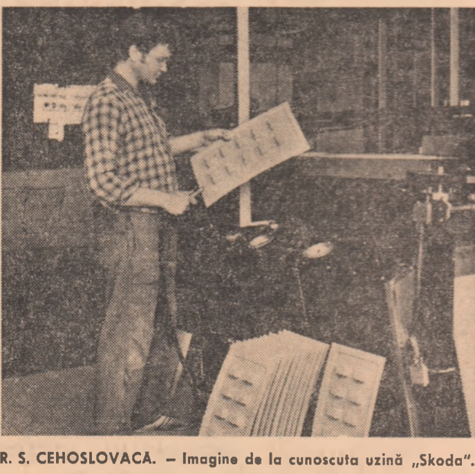
R. S. CEHOSLOVACA. — Imagine de la cunoscuta uzină „Skoda”.

Președintele Republicii Populare Congo, Marien Ngouabi, a deschis, la Brazzaville, lucrările Colocviului internațional „Populația și dezvoltarea”, organizat de Consiliul Mondial al Păcii, în cadrul manifestărilor Anului mondial al populației.