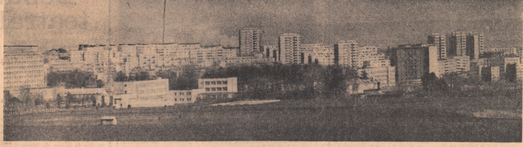
Citeva gatere, două tăbăcării, o topitorie de in, un abator și... la cam altă se rezuma industria județului Suceava la începutul anului 1948.