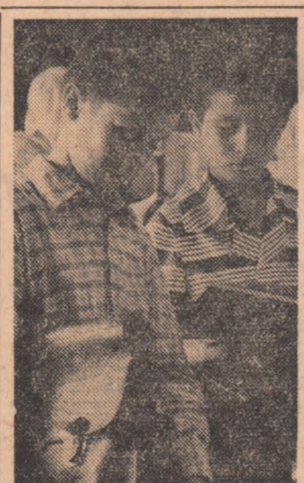
În pagina a IV-a

Din primele zile ale acestei săptămîni a crescut numărul județelor în care se desfășoară recoltările de toamnă. Floarea-soarelui, buzoara, a fost strînsă de pe 19 000 ha, iar sfecla de zahăr de pe 13 000 ha. Continuă, totodată, strîngerea altor culturi, precum și pregătirile pentru începerea însămînțărilor de toamnă. Pentru acest sezon, asigurat în lucrări agricole, unitățile de stat și cooperatiste s-au pregătit temeinic, astfel ca în timp cât mai scurt recolta să fie strînsă și depozitată în hambare. În acest scop, se vor folosi 18 000 de combine pentru recoltarea porumbului, florii-soarelui, soiei și orezului, 2 880 de combine și mașini pentru recoltarea cartofilor, 1 350 de utilaje pentru seos sfecla, precum și un număr sporit de mijloace de transport.