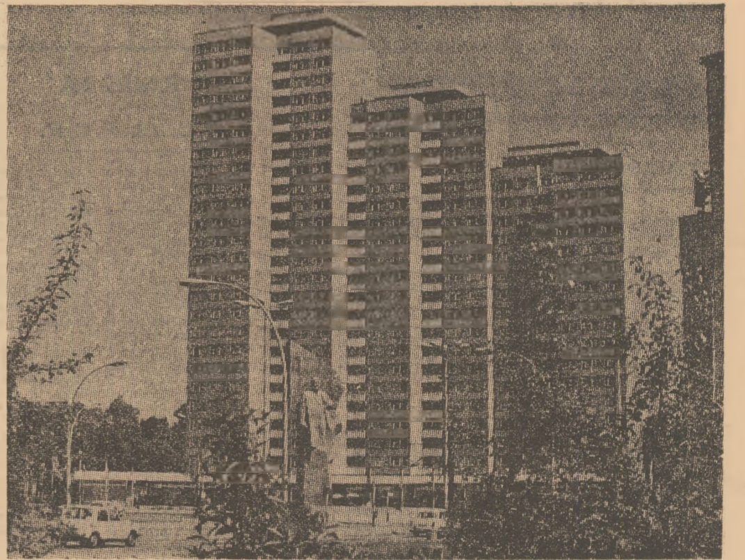
R. D. GERMANIA: Unul din cele mai frumoase cartiere de locuit ale Berlinului.