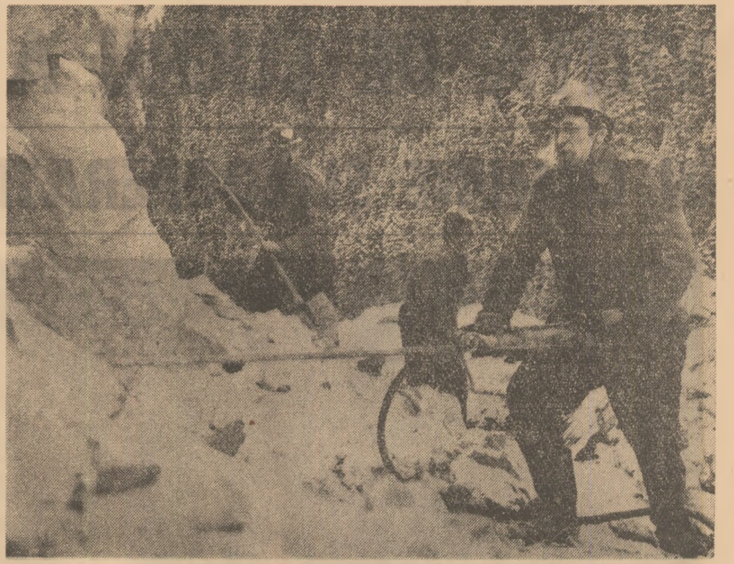
Bărbați la porțile munților