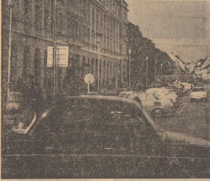
(Urmaso din pag. 1)