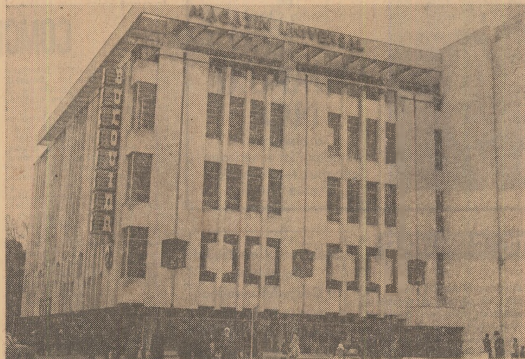
Noul magazin universal „Bucovina”, dat recent în folosință la Suceava