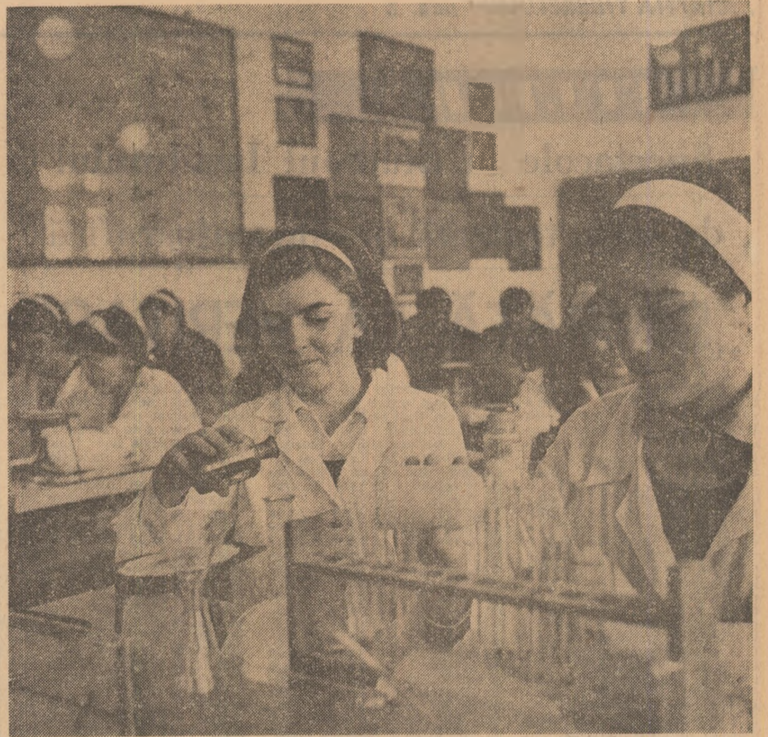
În laboratorul de fizică și chimie al Liceului „Al. Sahia” din Oltenița

Ce condiții sînt create tineretului și ce condiții își creează el însuși pentru ca acesta să-și valorifice timpul liber? Există în orașul Galați două case de cultură, a studenților și a sindicatelor, trei mari cluburi — C.A.Z., U.T.C.M. și C.S.C. — un teatru dramatic, un teatru de păpuși, un teatru muzical cu trei secții: estradă, operă și operetă, numeroase cinematografe. Însă prezența tineretului în sălile de spectacole, la activitățile cluburilor și caselor de cultură nu este pe măsura acestor posibilități. Milioane de lei au fost investite pentru construirea și dotarea acestor așezăminte de cultură, iar principalii beneficiari, tineretul, rămîne, în bună parte, în afara porților lor. Bibliotecă, săli spațioase, un arsenal de mijloace de informare, de reconfortare își așteaptă vizita-