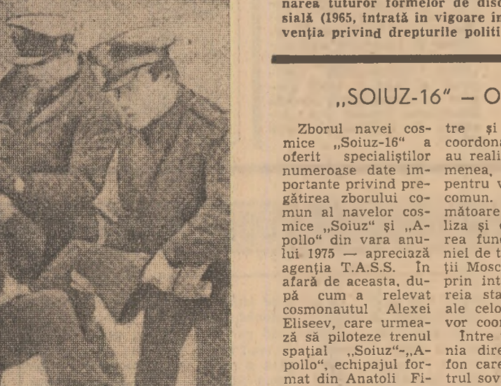
„SOIUZ-16” — O REPETIȚIE REUȘITĂ

Zborul navei cosmice „Soyuz-16” a oferit specialiștilor numeroase date importante privind pregătirea zborului în condiții normale al navelor cosmice „Soyuz” și „Apolo” din vara anului 1975 — apreciază agenția T.A.S.S. În afară de acestea, relevă reia stațiile terestre ale celor două țări pe coordonata zborului. „Soyuz-16”, se poate afirma reușita verificării întregului complex de sisteme și agregate noi, legate de viitoarea întințire în spațiu a navelor cosmice sovietice și americane în condițiile unui zbor real.