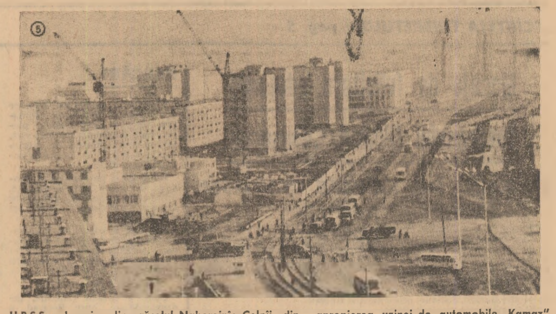
U.R.S.S. — Imagine din orașul Naberejniia Celnii, din apropierea uzinei de automobile „Kamaz”

La lucrările Congresului de constituire a „Tineretului Comunist Elvețian” luat parte și reprezentant Uniunii Tineretului Comunist din România.