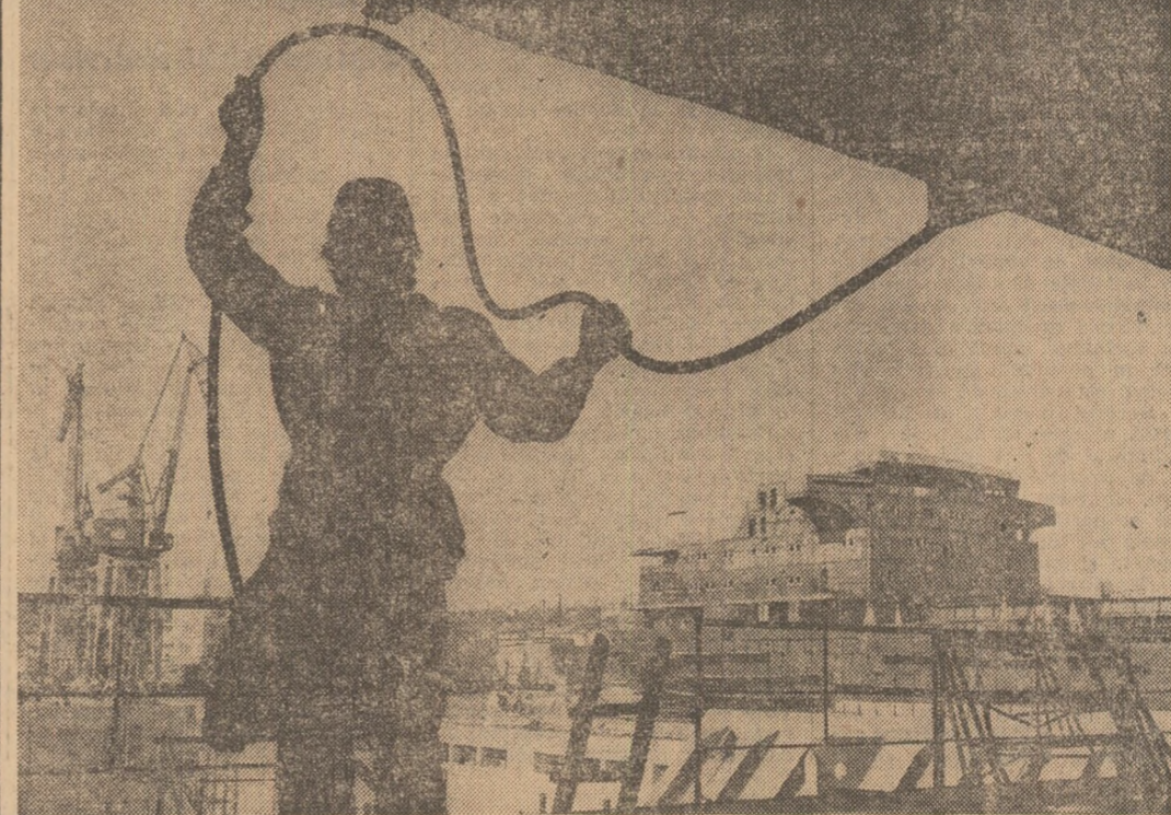
La Șantierul naval din Constanța, noul mineralier de 55000 tdtw se apropie tot mai mult de ziua întîlnirii cu marea