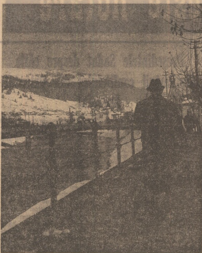
Iarna la Vatra Dornei