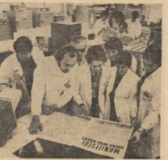
Apariția „Manifestului Frontului Unității Socialiste” a fost primită cu viu interes