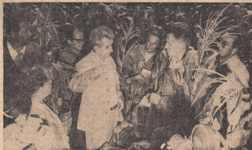
BRĂILA: terenul bun din această zonă trebuie să fie utilizat mai rațional

● SECRETARUL GENERAL AL PARTIDULUI A CONTROLAT LUCRĂRILE PENTRU LIMITAREA PAGUBELOR PROVOCATE DE INUNDAȚII ȘI MĂSURILE DE PROTECȚIE PENTRU STĂVILIREA UNDEI DE VIITURĂ A DUNĂRII ● INDICAȚII MOBILIZĂTOARE PRIVIND RESTABILIREA CIT MAI GRABNICĂ A ACTIVITĂȚII NORMALE, ÎNCHEIEREA ÎN TIMP OPTIM ȘI ÎN CELE MAI BUNE CONDIȚII A RECOLTĂTULUI ● INDEMN LA ACȚIUNI FERME PENTRU CA TOATE TERENURILE AFECTATE DE APE SĂ FIE REINSĂMINȚATE