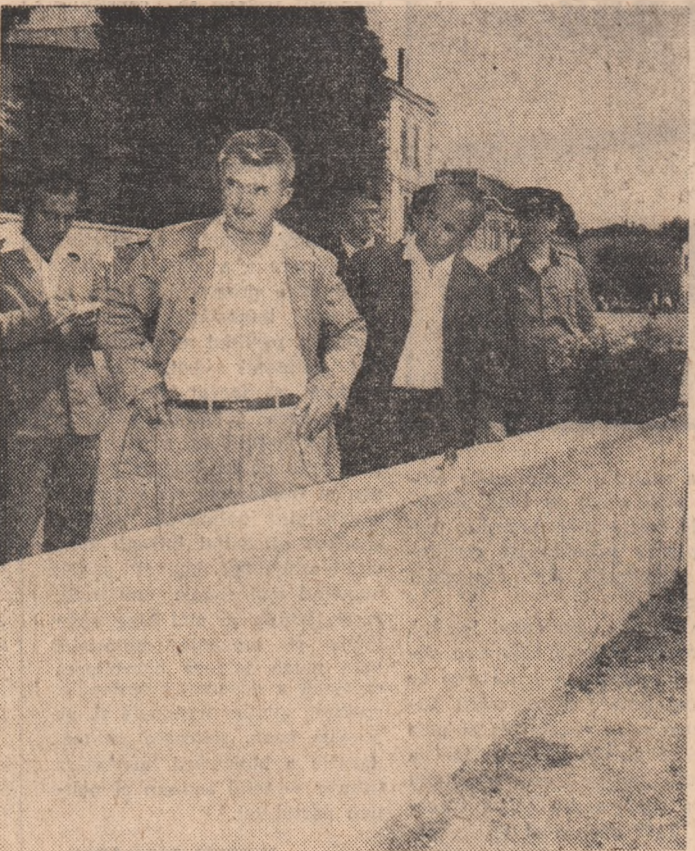
GALAȚI: în calca apelor oamenii au ridicat un puternic zid protector

● SECRETARUL GENERAL AL PARTIDULUI A CONTROLAT LUCRĂRILE PENTRU LIMITAREA PAGUBELOR PROVOCATE DE INUNDAȚII ȘI MĂSURILE DE PROTECȚIE PENTRU STĂVILIREA UNDEI DE VIITURĂ A DUNĂRII ● INDICAȚII MOBILIZĂTOARE PRIVIND RESTABILIREA CIT MAI GRABNICĂ A ACTIVITĂȚII NORMALE, ÎNCHEIEREA ÎN TIMP OPTIM ȘI ÎN CELE MAI BUNE CONDIȚII A RECOLTĂTULUI ● INDEMN LA ACȚIUNI FERME PENTRU CA TOATE TERENURILE AFECTATE DE APE SĂ FIE REINSĂMINȚATE