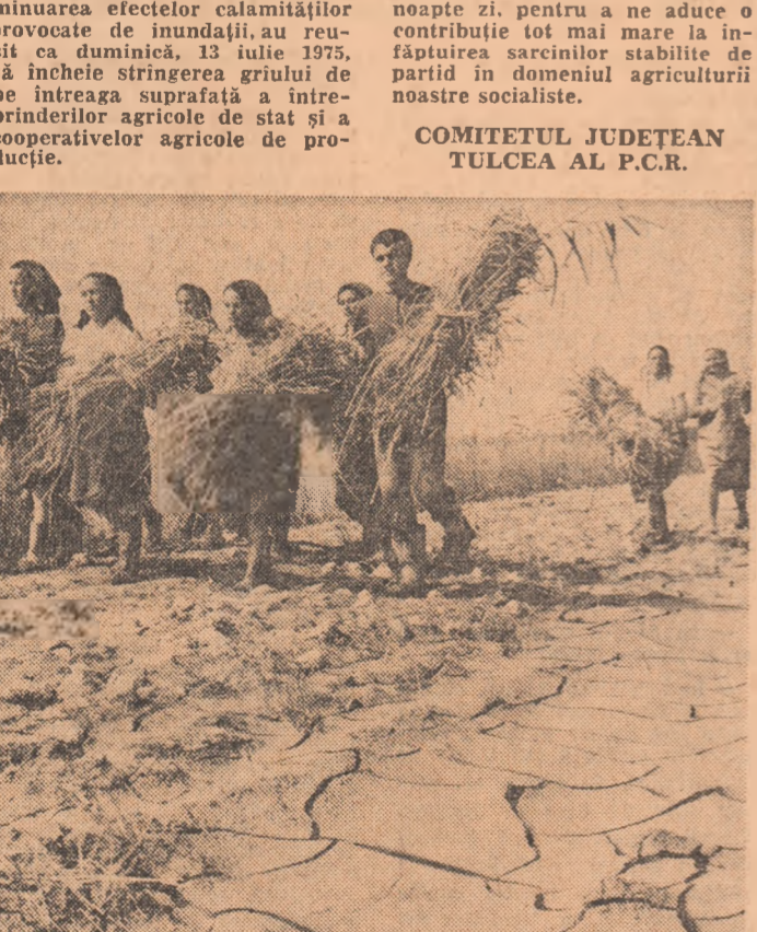
Județul Buzău a terminat recoltatul. Dar imaginea ultimelor spice secerate din terenurile inundate va rămâne o amintire neștersă de vreme.