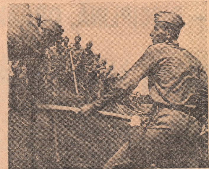
Ostașii forțelor noastre armate la datorie pe Insula Mare a Brăilei

— Care este, dincolo de aceste acțiuni, pulsul vieții și muncii, la această oră, în orașul dv.? — În agricultură se insistă asupra ultimelor suprafețe de recoltare. Nu se pierde o clipă de timp nici în industrie: se lucrează intens, cu sarcini sporite. La 10 iulie ne-am bucurat de vizita secretarului general al partidului. Prima în orașul nostru, și în atare condiții de excepție — prezența tovarășului Nicolae Ceaușescu, exemplul neobositei sale activități în politica țării și a țării — sunt în avans cîm remonștrii; celelalte unități ale industriei locale și-au depășit sarcinile de plan pe prima decadă a lunii iulie, dînd o producție suplimentară în valoare de 1,8 milioane lei. — Conform prognozelor înalte, astăzi viitorul ar fi rebuș să înlăcească orașul Corabia. Parcurgem încă o dată traseul celor 32 km de Dunăre oleană: kilometru cu kilometru — adică din post telefonic în post telefonic. La fiecare 3 km — o stație de radio emisie-recepție. Pe tot traseul — sistem provizoriu, dar eficient, de iluminat. În spațiile digului — viața și munca celor 21.000 de locuitori ai orașului. În condiții de deplină siguranță, dar și de conștiință veghe. Și desigur fluviul și-a aminat viitura, nu prognozzăm oînd susținem alături de primarul care, neacutînd metoara, ne-a spus la despărțire: „Corabia este un nume care nu va putea fi desprins niciodată de țarm“. ION ANDREIȚĂ PAVEL PERIL VASILE RANGA VALERIU TANASOFF