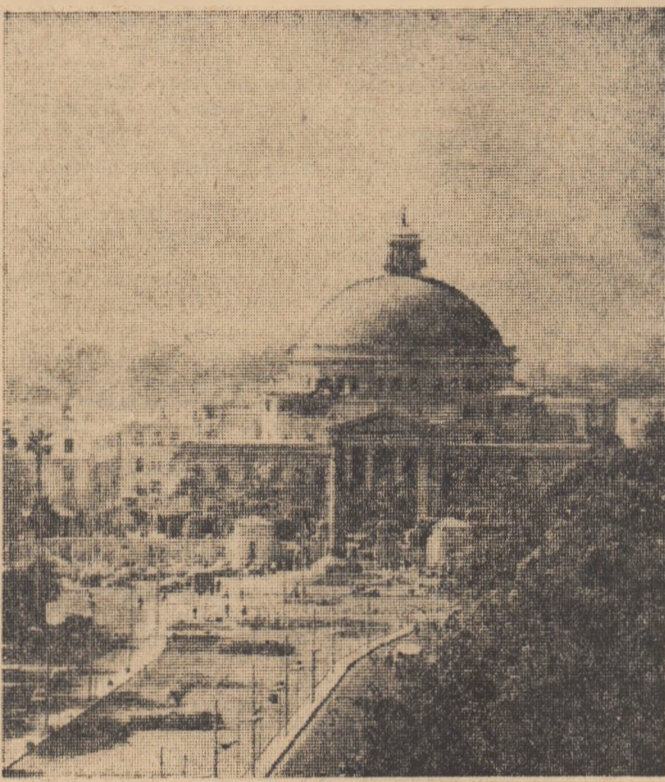
Imagine a Universității din Cairo

Pe de altă parte, autorii raportului precizează că perioada de recesiune a determinat menținerea ratei medii de inflație în jur de zece la sută și că țările O.E.C.D. vor putea ieși din această perioadă cu o creștere anuală a prețurilor de aproximativ opt la sută, cifră care reprezintă însă mai mult decît au vestitiiile care risică să diminueze posibilitățile de relansare a activității economice pentru o anumită perioadă.