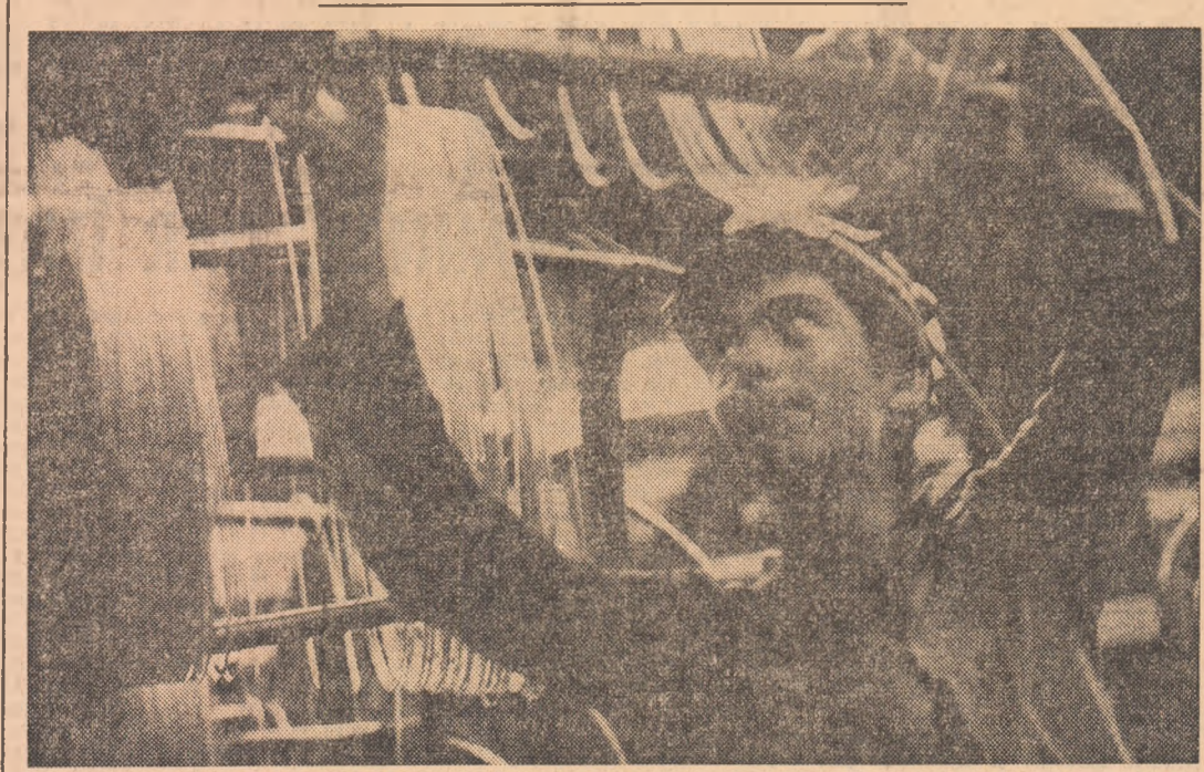
În trăgătoria de oțel moale a întreprinderii de sirmă și produse de sirmă din Buzău, aceeași atmosferă de muncă avântată pentru realizarea sarcinilor de producție