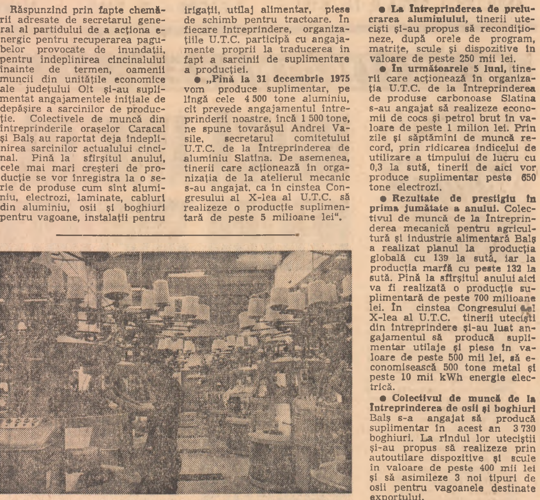
Aspect din secția tricotaje a Intreprinderii de tricotaje Caracal, unități cu mașini moderne de mare productivitate