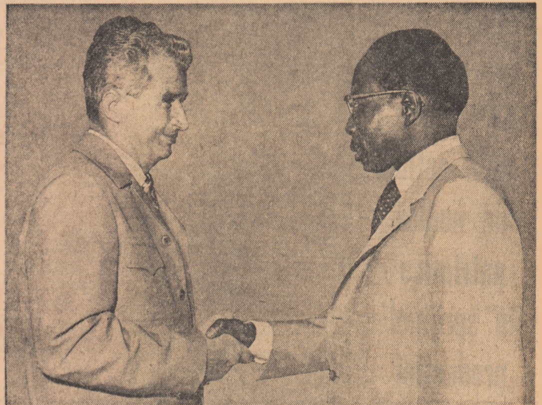
care l-a însoțit în vizita sa în țara noastră.

La sosirea elicopterului special cu care au călătorit președintele Nicolae Ceaușescu și Leopold Sedar Senghor, de la stațiunea Neptun, numeroși cetățeni aflați pe aeroport au făcut celor doi șefi de stat o călduroasă manifestare de simpatie, au acamat pentru prietenia dintre popoarele română și senegaleză.