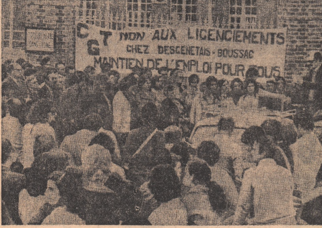
FRANȚA: Aspect de la un miting al muncitorilor de la uzinele Bousac din Bolbec împotriva concedierii forțate de conducerea întreprinderii.