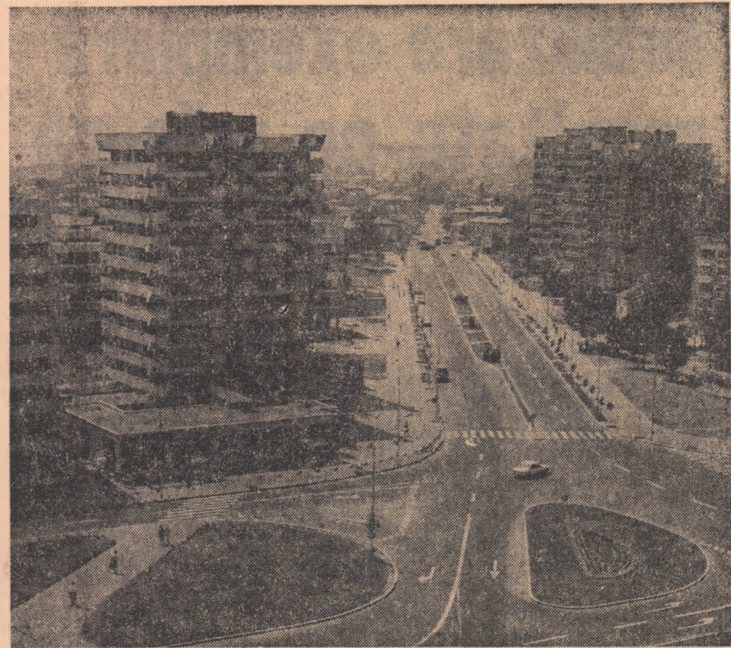
Din noul peisaj, socialist, al Craiovei, care sărbătorește astăzi aniversarea a 1750 de ani de la prima mențiune documentară a străvechii așezări daco-getice Pelemdava și 500 de ani de la prima atestare documentară.