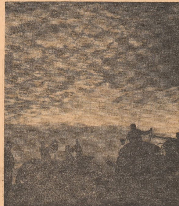
Pe ogoarele țării, mecanizatorii și cooperatorii grăbește ora finală a semănăturii — lucrările de calitate ale acestor toamne, asigurînd o bază trainică viitoare recolte de grâu.

Circulă o vorbă mai nouă în această parte de țară, cum că Bărăganul ar fi un meleag în care drumurile sînt asfaltate cu porumb. Dăruirea însăși, în trezirea ei pe lângă acest pămînt curat și sănătos ca pămîntul de flori, își limpezește solzii lichizi între două zbatări de lună întornată, în această ușor, dar tot pe-aici de greu de delimitat culoare. Este, desigur, o metaforă — și nu doar o metaforă — o realitate ridicată prin însăși demnitatea sa la sublim. Un astfel de drum, al porumbului, trece și prin comuna Furculești din Teleorman. Un drum înobilat toamnă de toamnă prin aurul de înalte carate al recoltei, prin sudoarea și chipul celor ce trudesc aici, păstrat efigie pe fiecare boabă de aur.